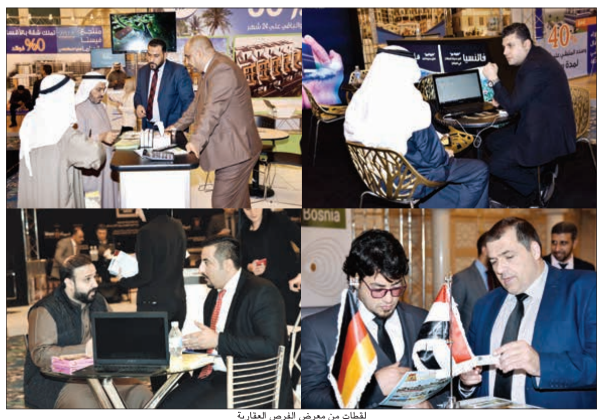
لقطات من معرض الفرص العقارية

يكتسب توسع فورد موتور كومياني إلى شركة للسيارات ووسائل النقل زخماً كبيراً مع كشف الشركة خلال معرض أميركا الشمالية الدولي للسيارات في ديترويت، عن شاحنة F-150 الجديدة، وإعلان عودة بيك أب رنجر إلى شمال أميركا، وسيارة برانكو إلى الأسواق العالمية، وتقديم رؤية فورد حول «مدينة المستقبل». وتؤكد أخبار فورد القادمة من المعرض، بما فيها توسيع خدمة مشاركة وسائل النقل المملوكة من فورد لتشمل 8 مدن جديدة، عزم الشركة على تعزيز منتجاتها الأساسية من السيارات مع التوسع بقوة في خدمات ووسائل النقل المتنامية. وفي هذا الصدد، قال مارك فيلزن، الرئيس والرياس التنفيذي لفورد: «يتخذ توسع أعمالنا كشركة للسيارات ووسائل النقل في هذا العام مني أكبر من المعتاد مع تقديمنا للمزيد من المركبات والتقنيات التي تسهم في تحول حياة الملايين من الناس إلى الأفضل على المدى القريب، بالإضافة إلى طرحنا لرؤية ومشاركة المدن لجعل حركة الناس أكثر كفاءة في المستقبل». وتأتي أخبار اليوم الأول من المعرض في أعقاب إعلانات سابقة عن توسيع أعمال فورد موتور كومياني، بإضافة 13 سيارة كهربائية جديدة، واستثمار 4.5 مليارات دولار أميركي على مدى السنوات الخمس القادمة، لتشمل طرازات هابيرد من شاحنة F-150 وموساتنج، ونموذجين من سيارات الشرطة الهابيرد المخصصة للمطاردة، وسيارة