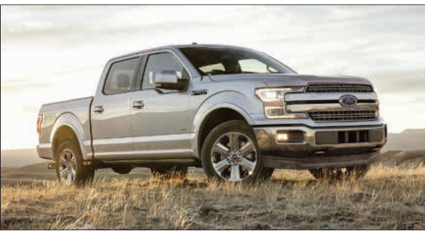
فورد F-150 الجديدة

من السيارات عام 2020. وسيتم تصنيع السيارات في مصنع ميشيغان لتجميع السيارات في واين بولاية ميشيغان. وصرح جو هينريش، رئيس فورد في أميركا بقوله: «لقد أضغينا إلى عملائنا بشكل قوي وواضح، فهم يريدون جيلاً جديداً من السيارات القوية إلى درجة كبيرة، وفي نفس الوقت توفر لهم المتعة في القيادة». وما وراء عالم السيارات، تعمل فورد مع المدن حول العالم للمساعدة في مواجهة التحديات المتنامية لوسائل النقل في بيئة المدن الحضرية، بما فيها الازدحام وتلوث الهواء.