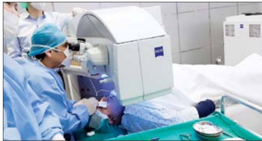
أحدث جراحات العيون في مستشفى دار الشفاء