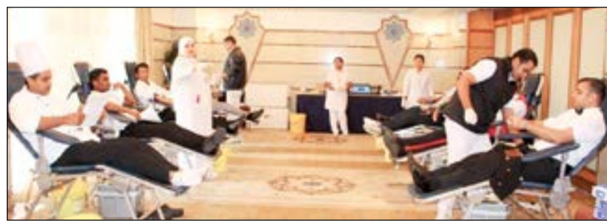
جانب من حملة التبرع بالدم

مع بداية العام الجديد، نظم فندق شيراتون الكويت وفوربوينتس شيراتون بالتعاون والتشجيع مع بنك الدم المركزي وذلك بهدف إثراء مخزون الدم الاستراتيجي لبنك الدم وإيماناً بأهمية تعزيز الدور الاجتماعي في خدمة القضايا الإنسانية. وقد احتضنت قاعة الزمردة في فندق شيراتون الكويت محطات التبرع بالدم، حيث شهدت الحملة أقبالا كبيرا من الموظفين الذين تسابقوا على تلبية الواجب الإنساني للمساهمة بأحدى الواجبات المهمة بالمجتمع والتي يكون لها أكبر الأثر ببناء الإنسان وضمان استمراريته.