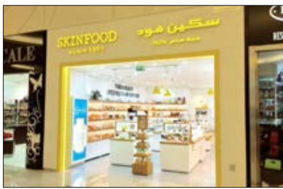
متجر «سكين فود» في «مول 360»

بسرنا افتتاح أول متجر للعلامة التجارية «سكين فود» في الكويت في «مول 360»، ويحظى المول بشهرة واسعة في جميع أنحاء المنطقة نظرا لمكانته المميزة حيث يوجد فيه قائمة فريدة من المتاجر الأشهر العلامات التجارية العالمية، ويتوافق هذا المتجر القائم على مفهوم رائد وبشكل مثالي مع القيم والمبادئ التي ترتكز عليها أعمالنا. وسيستج لنا إطلاق مثل هذه العلامات التجارية الجديدة لتلبية الاحتياجات المتنوعة لعملائنا المرموقين وتحسين رضاهم. وتفخر «سكين فود» بامتلاكها 966 متجرا في كافة أرجاء العالم، بما في ذلك المتجر الجديد الذي تم افتتاحه في «مول 360»، الذي يرحب بزواره في الطابق السفلي من المول.