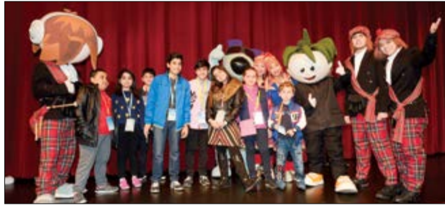
فرحة الأطفال في مهرجان الشتاء من «كيدزانيا»

من حول العالم»، والدخول إلى القصر الجليدي، والتلذذ بالذوق ومشروب شوكولاته ساخن، بالإضافة إلى هدية مجانية من كيدزانيا. وقد انطلق مهرجان الشتاء في «كيدزانيا» هذا العام بالتعاون مع كل من برجر كينج وكروكس وسيستمر حتى 4 فبراير المقبل. وتفوق تجربة «كيدزانيا» كونها مدينة للأطفال أو مركزاً للترفيه العائلي، فهي تنقل الترفيه التفاعلي والتعليم إلى مستويات مختلفة وجديدة من خلال دمج أداء الكبار في مهام الحياة الواقعية. تقدم كيدزانيا تجربة فريدة لمدينة يديرها الأطفال لتعليم وتنقيف الصغار من عمر 4 - 14 عاماً عبر المرور بمواقف حياتية متنوعة.