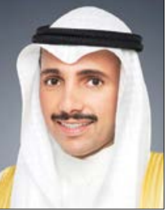
رئيس مجلس الأمة مرزوق الغانم