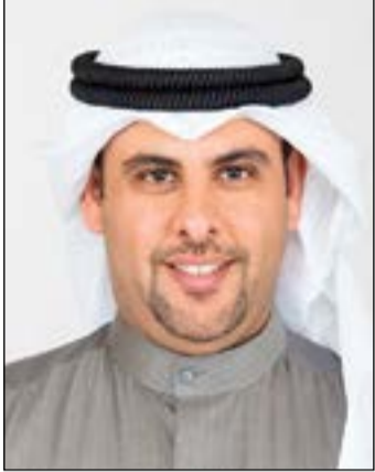
النائب يوسف الفضالة