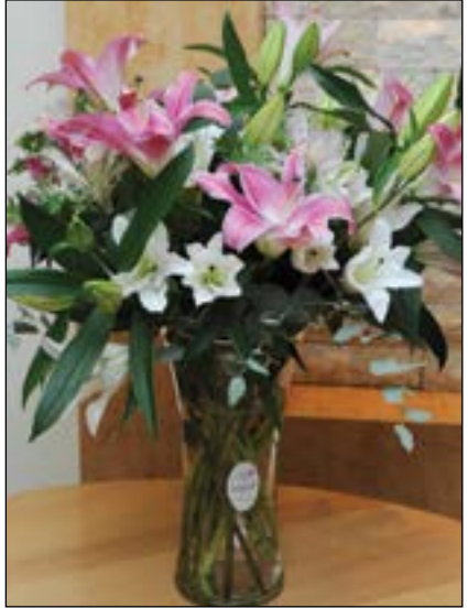
زهور من الشيخة بببي اليوسف في عيد «الأنباء» الـ 41