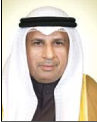
الوزير د.فالح العزب