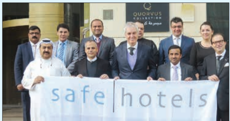
فريق «سيمفوني»، وفرحة بالشهادة

عقد الاجتماعات وفقا للمعايير الدولية لأمن الفنادق. وقد نجح فندق سيمفوني ستايل الكويت بالانضمام إلى برنامج الشهادة المميز هذا بعد تقييم وتدقيق سنوي للأمن والسلامة في الفندق ليتفوق بذلك على توقعات المسافرين فيما يتعلق بإجراءات السلامة. تشكل «مجموعة كورفس» جيلا جديدا من الفنادق الفاخرة المصممة بعناية فائقة والمستوحاة من أسلوب وآذواق المسافرين المعاصرين من مختلف دول العالم، وتمتاز هذه الفنادق بكونها فريدة وملهمة، حيث تقدم كل منشأة ضمن المجموعة تجربة استثنائية للضيوف، وتشجعهم على قضاء أفضل الأوقات في مكان إقامتهم، وتضم المجموعة حاليا كلا من فندق جي آند في رويال مايل هوتيل إنديرة، وفندق هيرمز جراند مسقط وفندق سيمفوني ستايل الكويت. ويتفرد كل فندق بهندسته العمرانية وأجوائه وتصاميمه، وتوسع المجموعة لتوسيع محفظتها لتشمل مجموعة من المنشآت التاريخية المعروفة والشقق السكنية المعاصرة والمتاجر التقليدية والمنتجعات المخصصة للاسترخاء، وتعد مجموعة كورفس» جزءا من مجموعة كارلسون ريزيدور للفنادق، والتي تضم أيضا «راديسون بلو» و«راديسون» و«راديسون ريد» و«بارك بلازا» و«بارك إن باي راديسون».