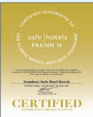
شهادة «البريميوم» للفنادق الآمنة