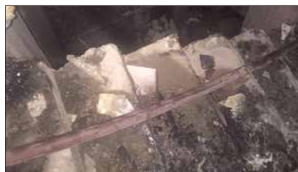
من حريق منزل القيروان

قضيتان عائلتان سجلتا في مخفري الزهراء والرميثة، هذا ما أبلغ مصدر أمني «الأنباء» موضحاً أن هناك عاملاً مشتركاً في القضية ألا وهو أن الزوجين في القضيتين من الجنسية اللبنانية. وبحسب مصدر أمني، فإن وافداً لبنانياً من مواليد 1972 تقدم إلى مخفر شرطة الزهراء للإبلاغ عن تعرضه للسلب والقتل والتهديد، وقال إنه كان في حديقة مركز الرؤية في منطقة الزهراء حيث التقى زوجته التي كانت برفقتها أبناؤهما وخلال وجودهم بالمركز فوجئ بزوجه تسببه وتهدهه بالحاق الأذى به، وسجلت قضية. من جهة أخرى، تقدم لبناني من مواليد 1968 ببلاغ إلى مخفر شرطة الرميثية وسجل قضية بعنوان خيانة أمانة. وقال في ملف القضية إنه أعطى زوجته سيارة أمانية موديل 2003 وبعد أن حدثت مشكلات زوجية بينهما طلب منها أن تعيد السيارة إليه فرفضت وقالت له: مالك عندي سيارة.