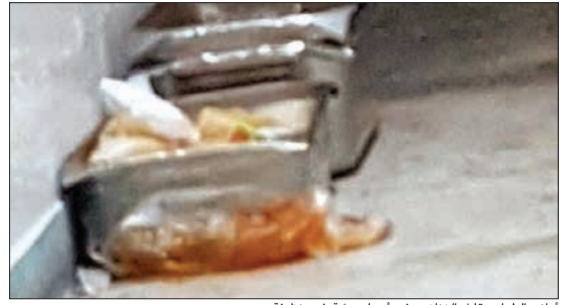
أواني الطعام مقابل الزنازين في أجواء بيئية غير نظيفة