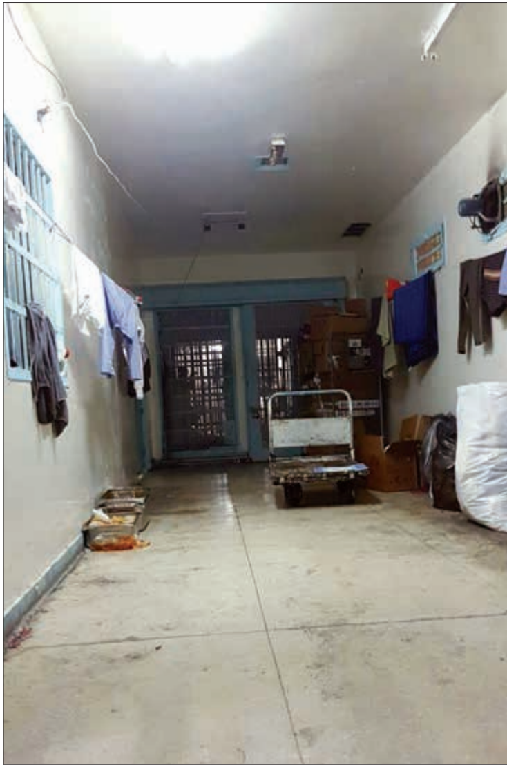
السجن المركزي بحاجة إلى فزعة