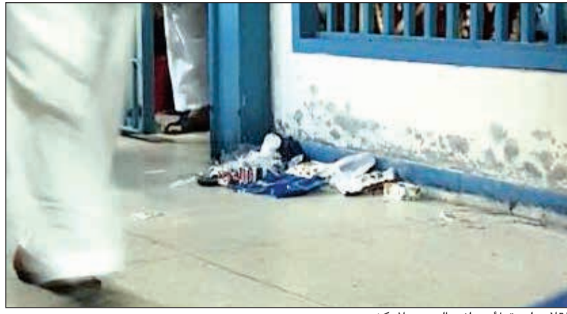
القاذورات تملأ جوانب السجن المركزي