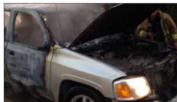
المركبة وقد اتت النيران عليها

منزل بمنطقة الصليبية، حيث توجهت فرق الإطفاء من مركز الصليبيخات وتبين أن النيران نشبت في مطبخ المنزل وتمكن رجال الإطفاء من اخماد الحريق دون وقوع أي إصابات بشرية، وتواجد في موقع الحادث رجال الأمن وعناصر الطوارئ الطبية. ومن جانب آخر، اخمد رجال