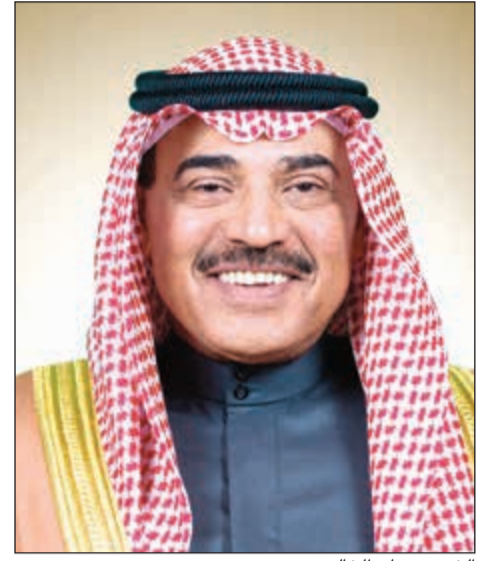
الشيخ صباح الخالد