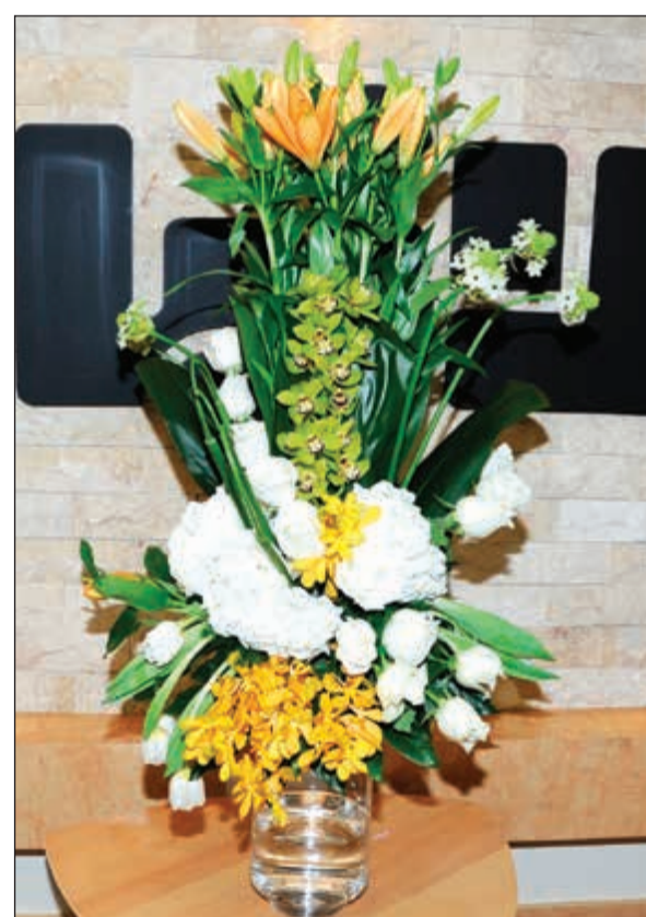
زهور من وزير الأوقاف والشؤون الإسلامية ووزير الدولة لشؤون البلدية محمد الجبري