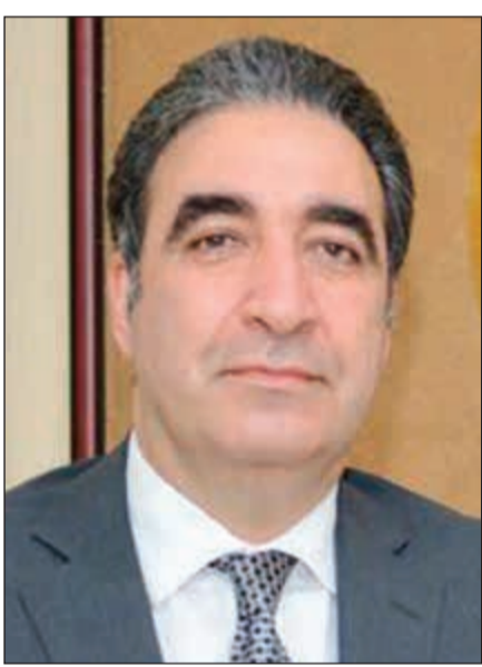
السفير ايلخان قهرمان

مع خالص تمنياتنا القلبية لشخصكم الكريم ولجريدتكم الموقرة ولجميع العاملين بها بدوام التقدم والازدهار ولكويت الامن والاستقرار تحت القيادة الحكيمة لحضرة