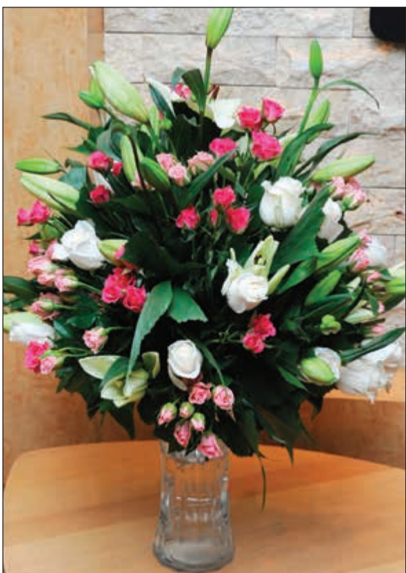
ورد من سفير جمهورية انزيبجان ايلخان قهرمان في عيد «الأنباء»

الموقرة تحتفل بذكرى صدورها الحادي والاربعين أن تهنئكم بهذه المناسبة، فلكم منّا خالص التهاني وأصدق الاماني بتحقيق المزيد من