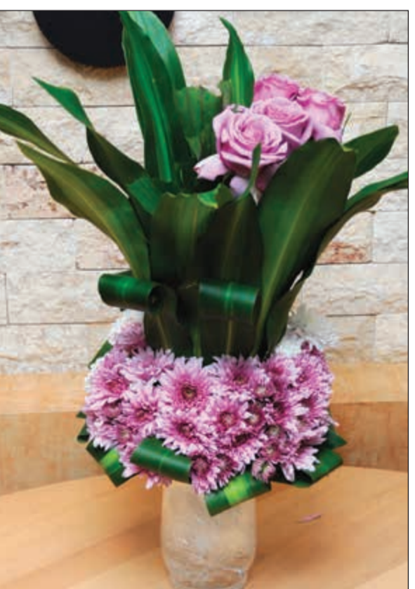
ورد من الأمين العام المساعد لشؤون حرس المجلس اللواء خالد الوقيت