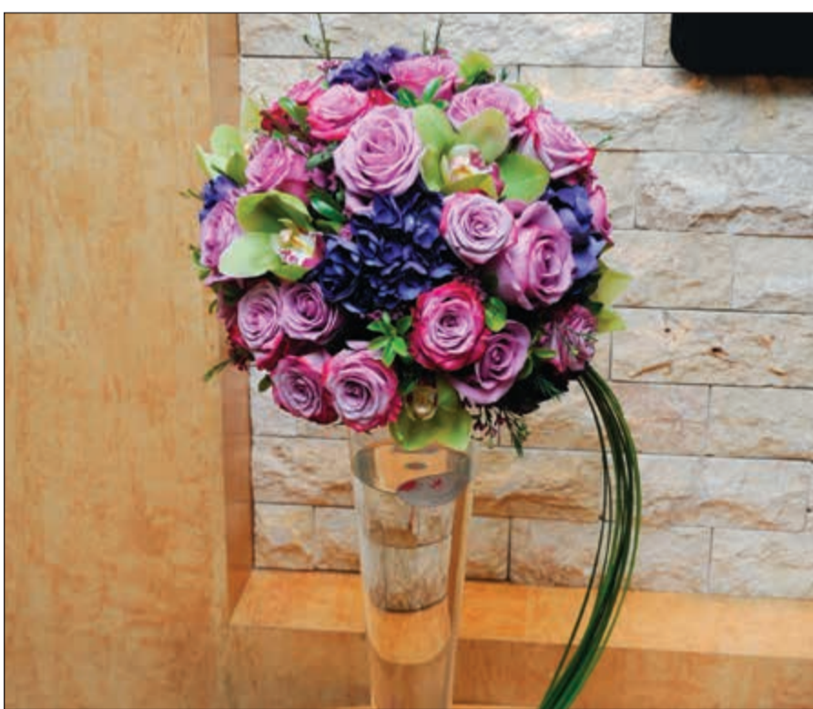
زهور من وزير التجارة والصناعة خالد الروضان في عيد «الأنباء» الـ 41

إن المهنية التي تتمتعون بها والتي تعد سمة بارزة في سياستكم التحريرية كان لها أكبر الأثر في ريادةكم وتقدمكم حرفية ومهنية صحافية راقية جعلت جريدتكم تحوز احترام القراء والمتابعين، وأدعو المولى عز وجل أن يدعم عليكم انجازتكم ونجاحاتكم المتميزة.