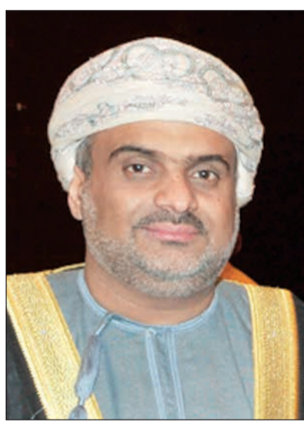
السفير حامد بن سعيد