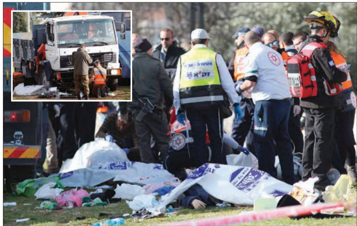
جثث احد القتلى مغطاة في موقع الدهس.. وفي الإطار الشاحنة التي استخدمت في الهجوم وتبدو على زجاجها آثار الرصاص

الجنود الذين أطلقوا الرصاص على السائق الذي غير الاتجاه وعاد ليصدمهم من جديد. وأضاف الشاهد الذي عرف نفسه باسم موشي فقط «أطلقوا الرصاص عليه حتى حيده». وتكرت محطات تلفزيون إسرائيلية أن السائق قتل وأظهرت لقطات أثار طلقات رصاص في الزجاج الأمامي للشاحنة. على سعيد آخر، اعترف السفير الإسرائيلي لدى بريطانيا، مارك ريجيف، عن تصريحات وردت في مقطع فيديو، سجل سرا لمسؤول في سفارته، يقول فيه إنه يريد التخلص من وزير الدولة البريطاني، لشؤون أوروبا والأمريكيتين، الآن ندكن. وقال ريجيف، في بيان نشرته وزارة الخارجية الذي وصفه أيضا بأنه «أبله»، الذي وصفه عليه صحيفة «ميل أون سنديا». وقال ماسوت، حسيما جاء في الفيديو، لأحد الصحفيين إن «الآن ندكن، بنير، كثيرا من المشاكل» أكثر من وزير الخارجية، بوريس جونسون، الذي وصفه أيضا بأنه «أبله». إلى ذلك، قالت صحيفة «هآرتس»، في عددها الصادر أمس، إن شبهات الفساد