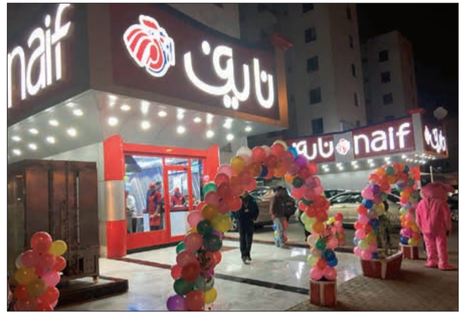
شهادة نايف للدواجن

مطاعمها تنتشر في 40 فرعاً موزعة إستراتيجياً في جميع محافظات الكويت