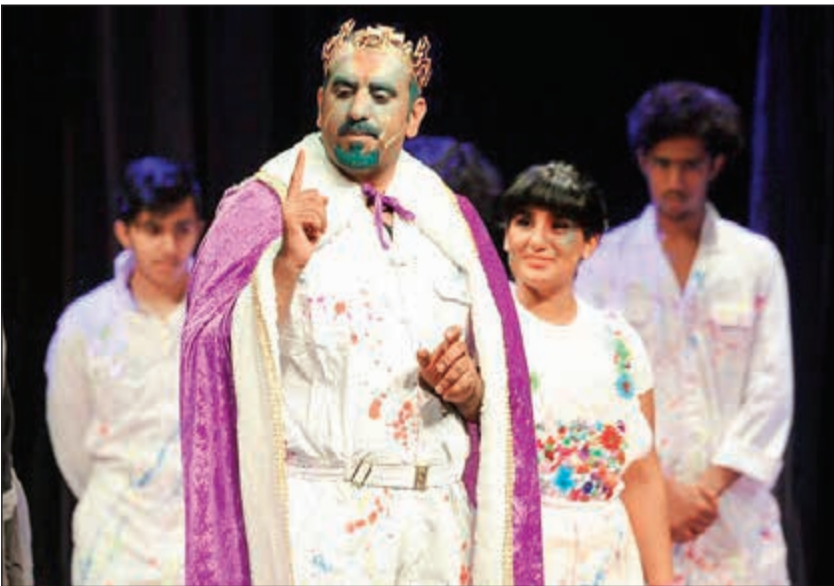
مشهد من «مدينة الألوان»