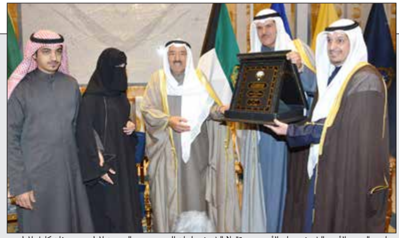
صاحب السمو الأمير الشيخ صباح الأحمد مستقبلاً الشيخ سلمان الحمود وعبداً الرحمن المطيري وحنان كامل المطيري

الأمير تسلم إستراتيجية «الشباب» بلغة «برايل»: تخدم المكفوفين وتسهل أمورهم الحياتية 02