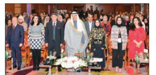
الشيخ سلمان الحمود يتقدم الحضور خلال افتتاح المؤتمر

سلمان الحمود ناب عن رئيس الوزراء في افتتاح المؤتمر الأول لاتحاد الإعلاميات العرب: الدعوات التحريضية في وسائل التواصل ساهمت في نشر العنف