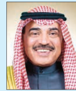
الشيخ صباح الخالد

■ محمد الجبري: «الأنباء» منارة للعمل الإعلامي المهني الوطني ■ خالد الروضان: دورها فعال في نقل الخبر بحيادية وشفافية