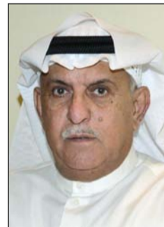
الخبير الفلكي عادل المرزوق

قال الخبير الفلكي عادل المرزوق انه وبعد مضي 5 أيام على دخول نوء «الشولة» البارد والذي يبدأ 2 يناير من كل عام وينتهي يوم 14 يناير، نجد ان معدل درجة الحرارة في هذه الأيام مرتفع بعض الشيء، وهذا ما يجعل بعض الناس يرددون كلمة «أفسدت الشولة» بمعنى ان فترة الشولة التي هي من أشد الفترات المناخية برودة في هذه الفترة أصبحت دافئة. وعزا المرزوق ذلك الى عدة اسباب، منها وقوع منطقة الخليج هذه الايام والايام المقبلة بين منخفض جوي بسيط قوته 1018 مليبارا ومرتفع جوي تبلغ قوته 1026 مليبارا، الأمر الذي يخفف من شدة اندفاع الرياح، بحيث لا تزيد سرعتها على 35كم/ساعة ويعجلها متقلبة الاتجاه وإن سيطرت عليها الرياح الجنوبية الشرقية الخفيفة السرعة (كوس مطلي) مع تقلب اتجاهها في بعض الايام حتى يوم الجمعة 13 الجاري، حيث تتحول الى رياح شمالية غربية قد تنشط بصورة واضحة وتزيد سرعتها الى 45كم/ساعة.