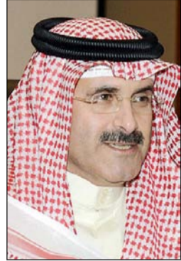
الشيخ مبارك الدميح