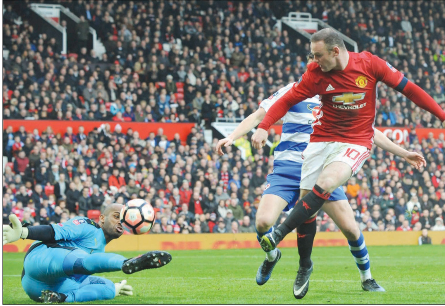
واين رونني مسجلا هدفة في مرمى حارس ريدينغ العماني علي الحبسي

عادل واين رونني رقم بوبي تشارلتون كأفضل هدف في تاريخ فريقه مان يونايتد وذلك بتسجيله هدف الأفتتاح على ريدينغ (درجة أولى) في المباراة التي انتهت بفوز ساحق لفريقه 4 - 0 أمس في الدور الثالث من مسابقة كأس إنجلترا لكرة القدم. وافتتح رونني التسجيل ليونابند، حامل اللقب، في الدقيقة 7 بعدما وصلته الكرة من عرضية للاسباني خوان مواتا فحولها بركبتها في شبك الحارس العماني علي الحبسي. ورفع رونني (31 عاما) رصيده الى 249 هدفا بقميص يونابند وعادل رقم تشارلتون الذي سجل اهدافه مع الفريق في 758 مباراة خاضها بين 1956 - 1973. اما رونني فسجل اهدافه الـ 249 في 543 مباراة خاضها مع «الشياطين الحمر» منذ ان انتقل اليهم عام 2004 من ايفرتون. وسبق لرونني ان حطم في اكتوبر 2015 الرقم القياسي من حيث عدد الاهداف المسجلة مع المنتخب وقدره 49 هدفا وكان مسجلا باسم تشارلتون بالذات، وهو رقم رصيده منذ حينها الى 53 هدفا في 119 مباراة، ونجح الفرنسي انطوني مارسيال في اضافة الهدف الثاني بعد مجهود فردي داخل المنتطة ليسيديس بعيدا عن متناول الحبسي (15). وفي الشوط الثاني اضاف الشياطين الحمر هدفين سجلهما ماركوس راشفورد اثر انفراد بالحبسي (75) ثم هو نفسه مستغلا خطأ فادحا للأخير (79). كما بلغ مان سيتي الدور الرابع بعدما قدم