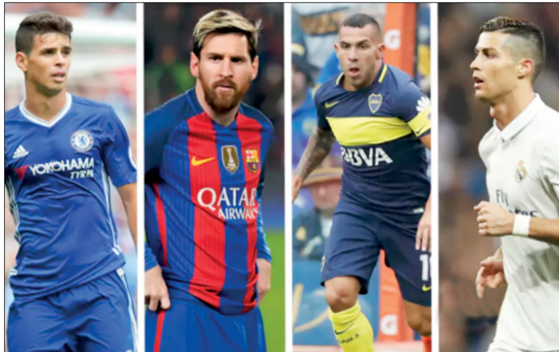
أمور الصين قلبت الموازين (أ.ب)

ظهرت الأندية الصينية خلال سوق الانتقالات في الفترتين الماضيتين، بشدة على الساحة من خلال التعاقدات مع أفضل اللاعبين في العالم وبرواتب مغرية وخيالية. وإنما ما كانت دول آسيا والخليج، تتعاقد مع اللاعب في نهاية حياته المهنية، لكن الأندية الصينية عكس ذلك، توقع مع النجم في أوج عطائه، وفي أفضل فتراته لكي يساعدهم في تحقيق البطولات والمجد، وليس في ناد أو اثنين، وإنما جميع الأندية ببلاد التنين تقائل في سوق الانتقالات. وخلال الانتقالات الشتوية الجارية، انتقل الأرجنتيني كارلوس تيفيز وأوسكار وفيتسيل وأخيرا جون أوبي ميكيل النيجيري للدوري الصيني ولم يكن أي منهم يحصل على كل هذه الأموال في ناديه. وفي هذا التقرير، نوضح لكم أكثر 10 لاعبين دخلا في العالم بعد غزو الصينيين: ● كارلوس تيفيز لاعب شينغهاي شنوا، يحصل على 615 ألف جنيه إسترليني أسبوعيا. ● أوسكار دوس سانتوس لاعب شينغهاي SIPG، يحصل على 400 ألف إسترليني أسبوعيا. ● كريستيانو رونالدو لاعب ريال مدريد، يحصل على 365 ألف إسترليني أسبوعيا. ● غاريث بيل لاعب ريال مدريد، يحصل على 350 ألف إسترليني أسبوعيا. ● ليونيل ميسي لاعب برشلونة، يحصل على 336 ألف إسترليني أسبوعيا. ● هالك لاعب شينغهاي SIPG، يحصل على 320 ألف إسترليني أسبوعيا. ● بول بوغبا لاعب مان يونايتد، يحصل على 290 ألف إسترليني أسبوعيا. ● بيبي لاعب شانغونج لونينغ، يحصل على 290 ألف إسترليني أسبوعيا. ● نيمار لاعب برشلونة، يحصل على 275 ألف إسترليني أسبوعيا. ● واين رونني قائد مان يونايتد، يحصل على 260 ألف إسترليني أسبوعيا.