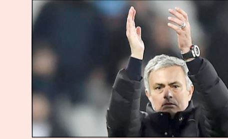
لن اتعاقد مع أي مدافع

استبعد البرتغالي جوزيه مورينيو المدير الفني لفريق مان يونايتد التعاقد مع مدافع خلال الميركاتو الشتوي الحالي. وارتبط «المان» بالتعاقد مع مدافع مثل جوزيه فونتي (ساوثمبتون) وفيتكتور لينديلوف لاعب (بنفكا)، من أجل تعزيز صفوف الفريق بمشاركة إيريك بابلي مدافع الشياطين الحمر مع ساحل العاج بكاس الأمم الافريقية هذا الشهر. وقال «المو» في تصريحاته نقلها موقع «فور فور تو»: سأنتظر بابلي وأتمنى أن يتمكن