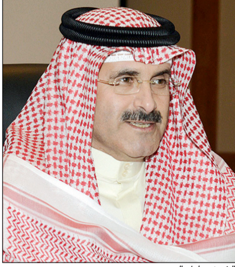
الشيخ مبارك الدعيج