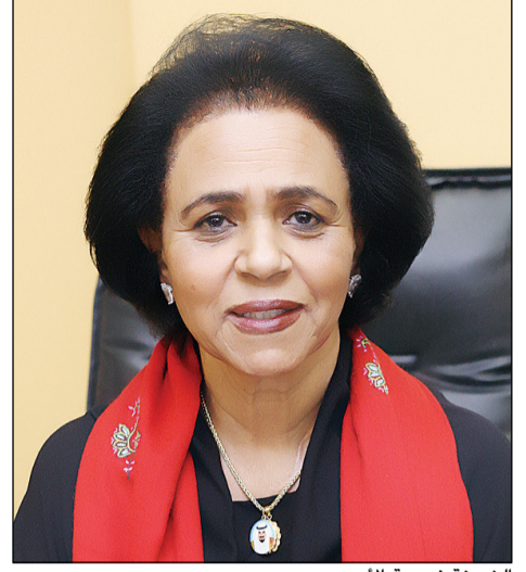
الشيخة فريحة الأحمد