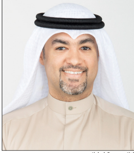
النائب عمر الطبطبائي