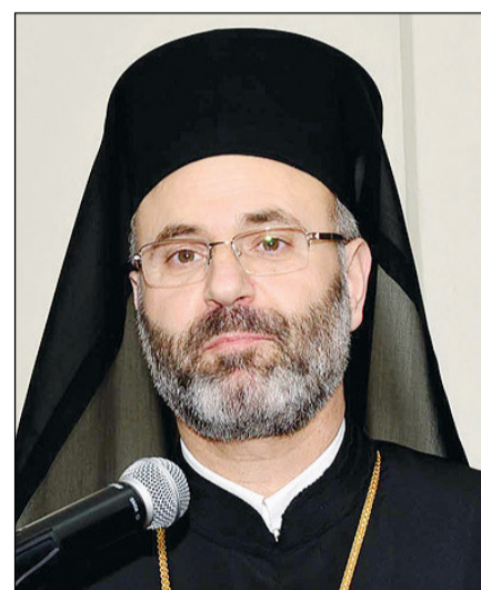
المطران غطاس متروبوليت بغداد والكويت