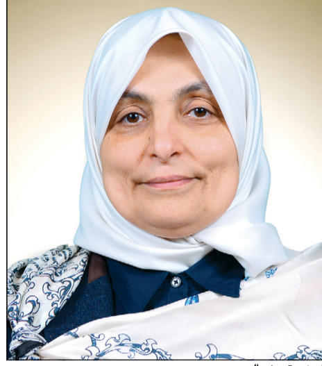
الوزيرة هند الصباح