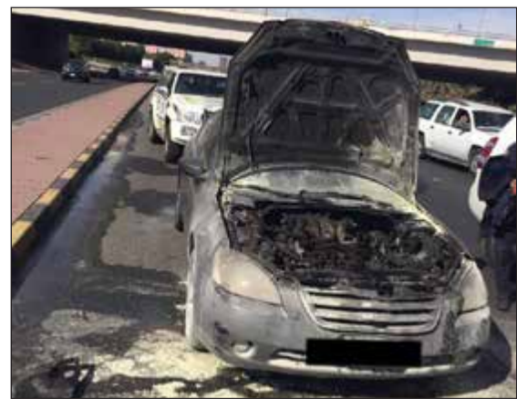
المركبة التي اتت عليها النيران على طريق الفحيحيل

مسمى حريق مركبة. من جانب آخر، تلقى مركز عمليات الإدارة العامة للإطفاء بلاغا مساء اول من امس