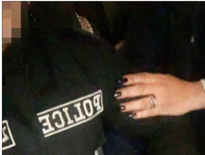
العسكري أثناء تصويره مع الحسناء

شرع رجال الرقابة والتفتيش بوزارة الداخلية في البحث عن عسكري قام بالتصوير مع فتاة، وتم تداول الصورة عبر «الواتساب»، وعليه رفع تقرير بالواقعة. وقال مصدر امني إن رجال إدارة الرقابة والتفتيش قاموا برصد صورة سيلفي نشرت على موقع واتساب لعسكري بلباسه الرسمي وهو يحتضن فتاة.