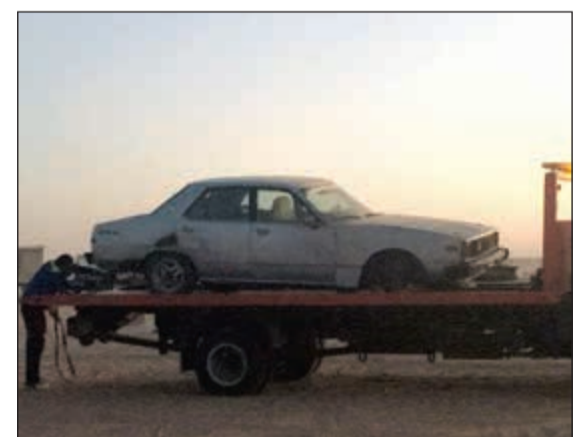
إحدى المركبات الرياضية التي تم ضبطها

وحجز مركبتين جي تي، بالإضافة إلى ذلك تحرير 847 مخالفة على طرق (الصبيبة) والعدلي والسالمي)، كذلك ضبط 2 سباق على الطريق و11 حدنا وتحرير 83 مخالفة سرعة، وكانت أعلى سرعة 193 كم في الساعة، بالإضافة إلى ذلك إحالة شخصين إلى نظارة المرور وبضبط 4 جي تي مخالفة شروط الأمن والمتانة.