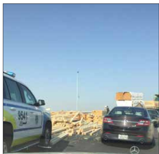
الأخشاب بعد سقوطها على الجسر

شهد طريق الدائري الرابع السريع حادث سقوط أخشاب على الجسر المؤدي إلى مدخل الجبراء دون أن تقع أي إصابات. وقال مصدر امني إن بلاغا ورد صباح امس الأول إلى غرفة عمليات الداخلية عن سقوط أخشاب على الجسر، ما تسبب في عرقلة السير وتدخل رجال المرور لسحب الأخشاب التي سقطت من الشاحنة. من جانب آخر، اصطدم قائد مركبة رباعية الدفع بالحاجز الواقع بالطريق الحديث المؤدي إلى جامعة الكويت في منطقة الشويخ ولم يسفر الحادث عن وقوع أي إصابات.