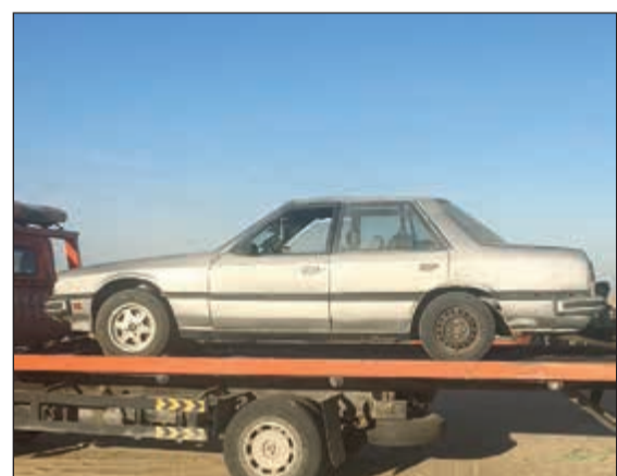
... وأخرى في طريقها إلى الحجز

جاءت هذه الحملات بتعليمات من نائب رئيس الوزراء ووزير الداخلية