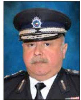
الفريق سليمان الفهد

أصدر وكيل وزارة الداخلية الفريق سليمان الفهد أوامره إلى إدارة شرطة البيئة بمتابعة جميع المخالفات البيئية في موضوع مخلفات البناء وغيرها من المخلفات والتي يتم إلغاؤها في بعض المواقع التي يجرمها القانون وغير المخصصة لذلك.