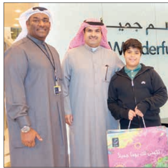
الفائز متسلماً للجوائز

وبينت الشركة أنه مقابل كل دينار واحد يقوم العميل بدفعه عن طريق موقع زين الإلكتروني (pay.kw.zain.com) أو عن طريق تطبيق زين للهواتف الذكية يحصل على فرصة في السحب إلى الأسبوعية بالإضافة إلى الدخول في السحب على