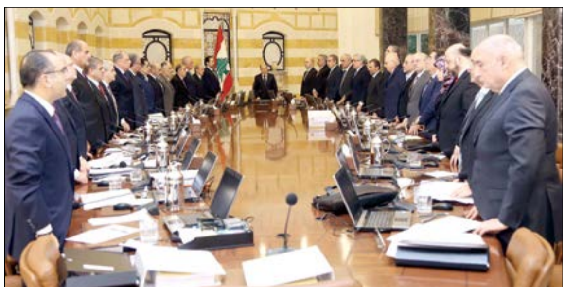
الحكومة اللبنانية تفق دقيقة صمت حدادا على مقتل اللبنانيين في هجوم اسطنبول ليلة رأس السنة

بيروت: عرض وزير الإعلام لمحرم الرياشي مع رئيس مجلس النواب نبيه بري لشؤون وشجون الساعة والحادثة في تركيا، ووضع وزارة الإعلام يتركزها لتطوير الوزارة. وخلال الزيارة قام بهي إلى عين التينة، أكد الرياشي أن بري إيجابي جدا وسيساعد لأقصى الحدود من أجل تطوير وزارة الإعلام. وأضاف: تحدثنا عن الوضع السياسي والعلاقة بين «القوات اللبنانية» وحركة «أمل»، وكان الجو ممتازا جدا.