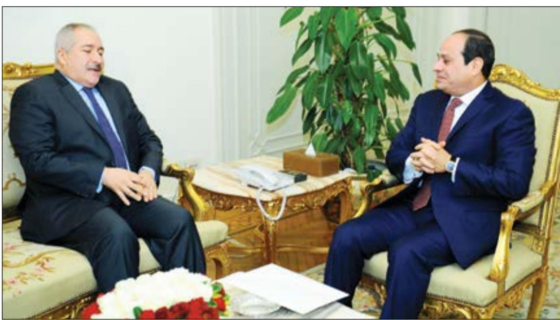
الرئيس عبدالفتاح السيسي مستقبلا نائب رئيس الوزراء ووزير الخارجية الأردني ناصر جودة

بدوره، قال وزير الزراعة عصام فايد إن مجلس الوزراء وافق أمس على شراء القمح المحلي من المزارعين المحليين بالسعر العالمي الذي تشتري به هيئة السلع التموينية من الخارج. وكانت لجنة الزراعة بمجلس النواب المصري أوصت في ديسمبر برفع سعر توريد القمح إلى 650 جنيها (35.6 دولارا) للأردب (150 كيلوغراما) من 420 جنيها في الموسم الماضي والموافقة على رفع سعر شراء قصب السكر من المزارعين من 500 جنيه للطن إلى 620 جنيها. وأضاف أنه سيتم شراء القمح من الفلاحين بم توسط سعر الدولار لأخر شهرين سابقين (من الشراء).