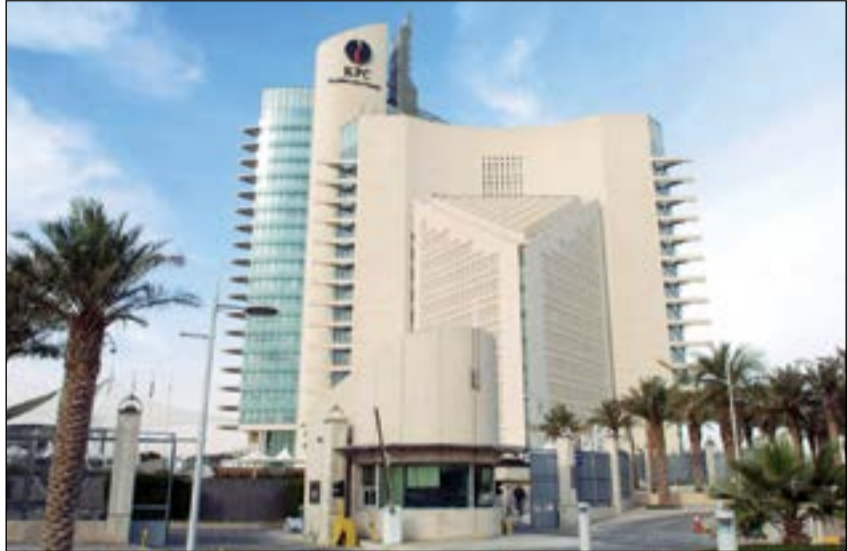
الكويت تلتزم باتفاق «أوبيك» وتخفيض إنتاجها النفطي

وتتأسس الكويت لجنة مراقبة الاتفاق النفطي والتي تضم كلا من الجزائر وقنزويلا من منظمة «أوبيك»