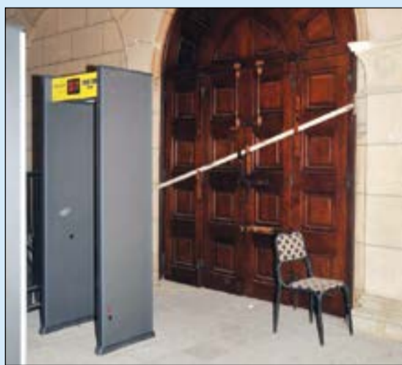
.. وتركيب أبواب الكترونية