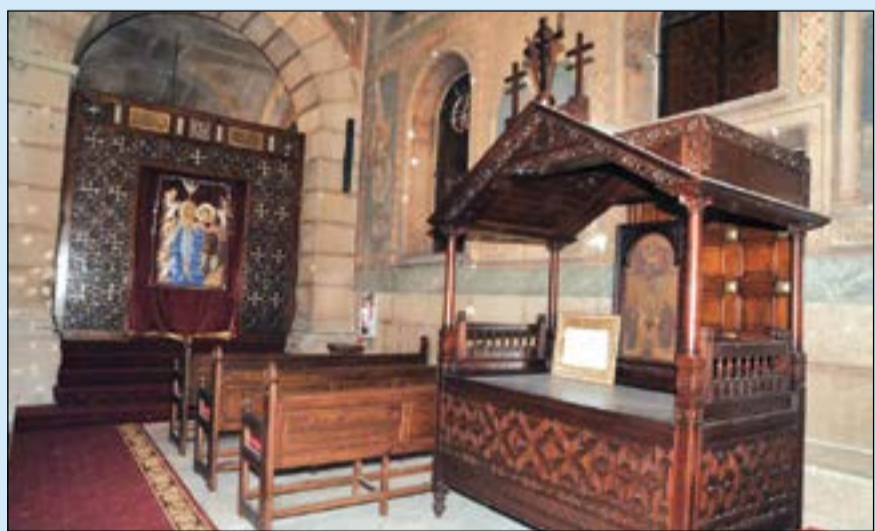
هكذا عادت الكنيسة البطرسية إلى وضعها الطبيعي

استبعدت مصادر حكومية مطلعة بمجلس الوزراء لـ «الأنباء»، إمكانية إجراء أي تعديلات وزارية خلال الشهر الجاري، لحين مرور ذكرى ثورة 25 يناير، وانتهاء الحكومة من مناقشة تقرير الأداء نصف السنوي في مجلس النواب، ومشيرة إلى أن فكرة التغيير الوزاري قائمة حتى اللحظة الراهنة، ولكن توقيت إعلانه يخضع لتقديرات القيادة السياسية، خصوصاً أن الإجراءات الاقتصادية التي بدأتها الحكومة غير قابلة للتراجع أو تغييرها جذرياً، وقالت إن أي حكومة جديدة ستكون ملتزمة بتنفيذ البرنامج الاقتصادي المتفق عليه والمقدم إلى صندوق النقد.