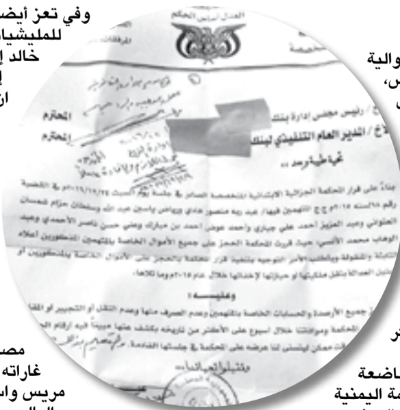
نسخة من توجيه نيابة خاضعة للحوثيين بحجز أرصدة الرئيس اليمني وعدد من قيادات الشرعية

ميدانيا شنت مقاتلات الأباتشي التابعة للحلف العربي في ساعة متأخرة من مساء أمس الأول وحتى فجر امس قصفاً عنيفاً تستهدف تعزيزات وتجمعات الميليشيات الحوثي وصالح في كورنيش المخا غرب محافظة تعز مخلقة قتلى وجرحى في صفوف المتحاربين، ودمرت عدد من الآليات العسكرية بعد ساعات من وصول تعزيزات قادمة من الحديدة،