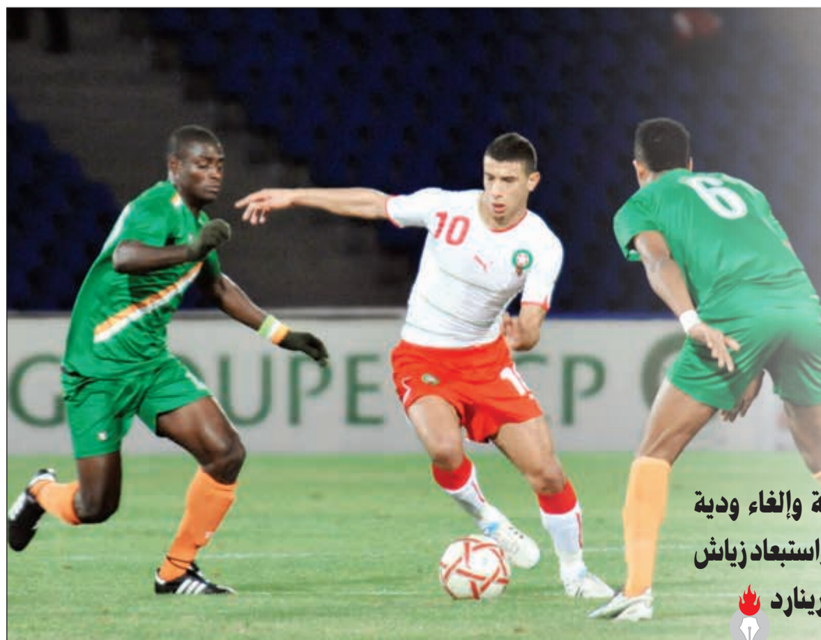
غياب يونس بلهندا شكل صدمة لمتابعي منتخب المغرب

وتلقى رينارد ضربة موجعة بعدما تأكد غياب لاعبين اثنين، كان يعول عليهما كثيراً في المنافسة الأفريقية، يعتبران من الأسماء الأساسية في تشكيلة، ويخشى أن يترك غيابهما فراغاً كبيراً بالمنتخب المغربي. ويتعلق الأمر بنجم نيس الفرنسي يونس بلهندا الذي أعلن انسحابه من المنافسة قبل انطلاق