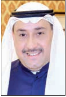
الشيخ فيصل الحمود

يرعى محافظ الفروانية الشيخ فيصل الحمود مهرجان بطولة محافظة الفروانية لسباقات الخيل، وذلك عصر يوم الجمعة المقبل بشارع فروسية الفروانية.