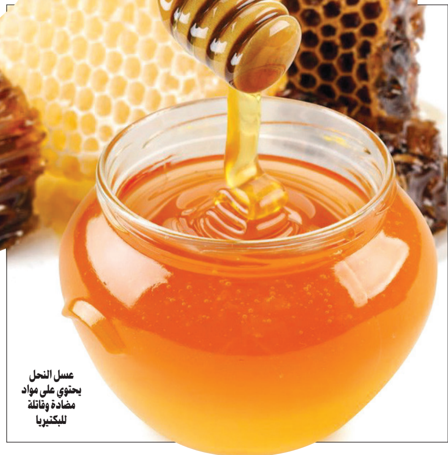
عسل النحل يحتوي على مواد مضادة وقاتلة للبكتيريا