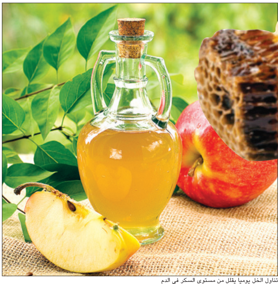
تناول الخل يوميا يقلل من مستوى السكر في الدم