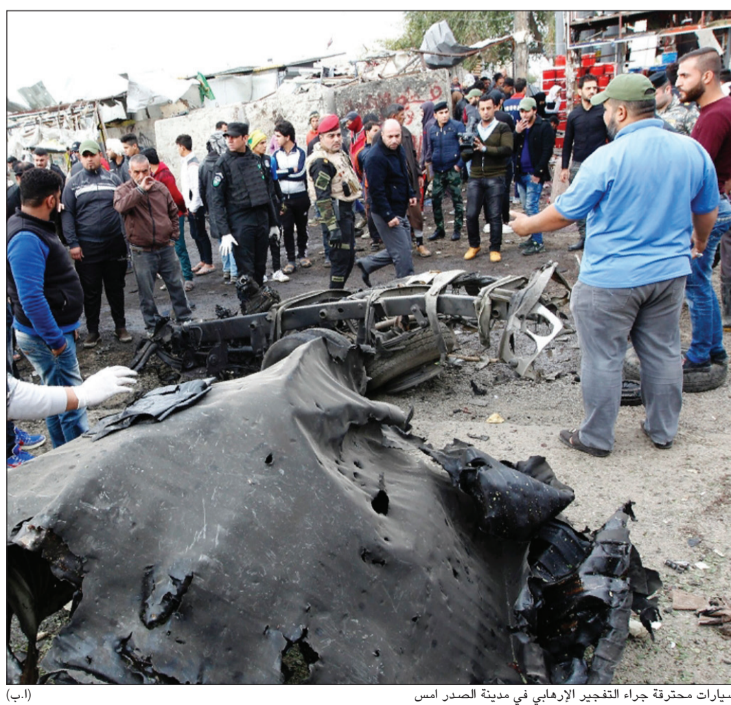
سيارات محترقة جراء التفجير الإرهابي في مدينة الصدر امس

بغداد - وكالات: ضربت العاصمة العراقية، بغداد، امس موجة تفجيرات عنيفة أوقعت عشرات القتلى والجرحى، بالتزامن مع زيارة الرئيس الفرنسي فرانسوا هولاند. واستهدف الهجوم الأعمق الذي تبناه تنظيم «داعش»، ساحة مكتظة بالعمال خلال وقت الذروة في مدينة الصدر، شرقي بغداد، حيث فجر انتحاري سيارة مفخخة كان يقودها وسط تجمع للعمال. وبعيد ذلك لقليل استهدف تفجيران تجمعين للمدنيين، أحدهما شرقي بغداد، والآخر في مدينة الصدر قرب العاصمة أيضاً. وتلا ذلك استهداف 3 عبات ناسفة لسوق شعبي وعبادة طيبة، بمنطقة الشعب، شمالي بغداد. وجاءت موجة التفجيرات العنيفة تزامناً مع زيارة الرئيس الفرنسي فرانسوا هولاند إلى بغداد، والذي أكد، خلال لقائه بالمسؤولين العراقيين، التزام باريس بدعم العراق في الحرب ضد «داعش» لحين هزيمته نهائياً، متوقفاً أن تستمر معركة الموصل لدحر هذا التنظيم الإرهابي أسابيع وليس سنوات. من جهة أخرى، شن مسلحو «داعش» هجوماً جديداً من محور الفتحة والسكريات شمال شرق مدينة بيجي شمال بغداد. وأحرز التنظيم تقدماً في هذه المنطقة على حساب القوات الحكومية، كما أرسل تعزيزات لدعم مواقعه تضم مقاتلين وأسلحة وأعدته. ● التفاصيل ص 30