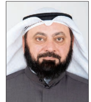
د. وليد الطبطبائي

طالب النائب د. وليد الطبطبائي وزير الإعلام ووزير الشباب الشيخ سلمان الحمد بالاستقالة بتاريخ 12 الجاري ما لم يتم رفع الإيقاف عن النشاط الرياضي الكويتي دوليا في تاريخ 11 من يناير الجاري. وقال الطبطبائي في تصريح للصحافيين في مجلس الأمة أمس أنه في حال لم يرفع الإيقاف عن النشاط الرياضي ولم يقدم الوزير الحمد استقالته «فإنني سأقدم له استجوابا بتاريخ 13 الجاري».