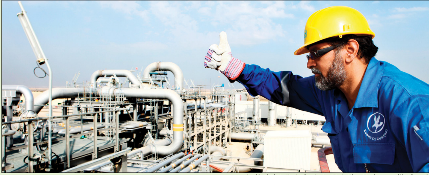
الكويت أول الملتزمين بقرار خفض الإنتاج الذي اتخذته «أوبك»، للحفاظ على الأسعار

انعكاسات إيجابية لخفض إنتاج «أوبك» والأسعار إلى ارتفاعات