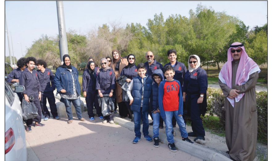
مجموعة من المشاركين في الحملة التطوعية

والحضاري على المدينة. ونقل البيان أن مشاركة المحافظة في تنظيم الحملة تأتي من خلال مسؤوليتها المجتمعية الهادفة إلى تعزيز العمل التطوعي، لافتاً إلى حرص المحافظة على تقديم كل التسهيلات ووضع إمكاناتها لنجاح الحملة لإنشاء العمل البيئي في البلاد خصوصاً في ظل غياب بايدي شبابية كويتية. من جهتها، قالت مسؤولة الحملة د.قضاء الكوچ ان حملة «كويت اليوم 15» بدأت من شارع المطار بمشاركة العديد من