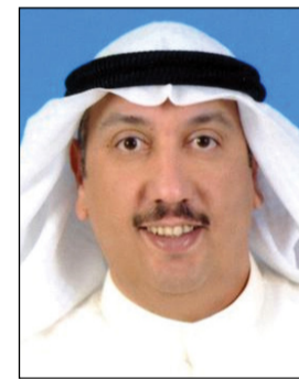
العقيد محمد الوهيب

أعلن الجهاز المركزي لمعالجة أوضاع المقيمين بصورة غير قانونية أن 8157 شخصا عدلوا أوضاعهم خلال الفترة ما بين مطلع عام 2011 ونهاية شهر ديسمبر 2016. وقال مدير إدارة تعديل الأوضاع في الجهاز العقيد محمد الوهيب لـ «كونا» أمس أن 5637 شخصا من هؤلاء تم تعديل أوضاعهم إلى الجنسية السعودية في حين جرى تعديل أوضاع 923 آخرين إلى الجنسية العراقية. وأضاف العقيد الوهيب أن 816 شخصا عدلوا أوضاعهم إلى الجنسية السورية و94 شخصا إلى الجنسية الإيرانية و49