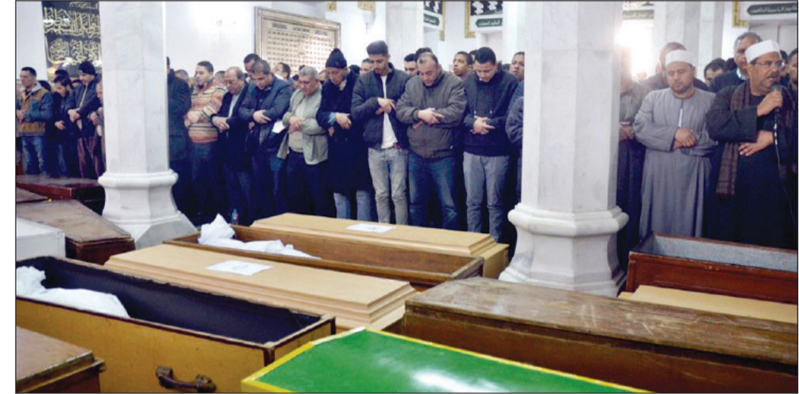
تشجيع جثامين طاقم الطائرة المصرية المنكوبة من مسجد السيدة نفيسة