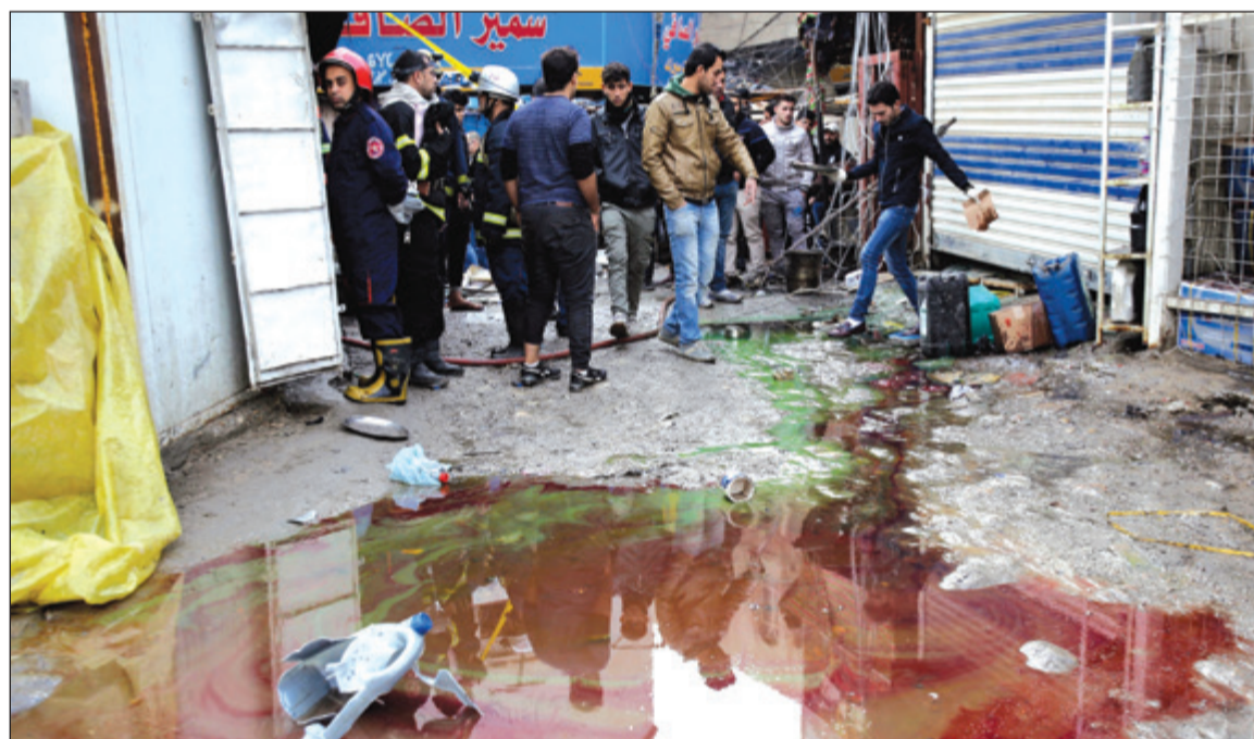
المداء تغطي موقع التفجير في أحد أسواق بغداد أمس (أ.ب)

بغداد - وكالات: قالت الشرطة ومسعفون إن انفجارين وقعوا في سوق مزدحم بوسط العاصمة العراقية (بغداد) أمس أسفرا عن سقوط عشرات بين قتيل وجريح. وذكرت الشرطة الانفجارين وقعا قرب متاجر لبيع قطع غيار السيارات في حي السنك خلال ساعة الذروة الصباحية. وأسفر الاعتداءان عن الانتحاريان المتزامنان عن مقتل 27 شخصا على الأقل وإصابة نحو 50 في أسوأ هجوم يطول العاصمة العراقية منذ شهور. وقال عقيد في الشرطة لوكالة فرانس برس «هناك 27 قتيلًا و53 جريحًا»، بينما كانت حصيلة سابقة للشرطة أشارت إلى 18 قتيلًا و38 جرحيا.