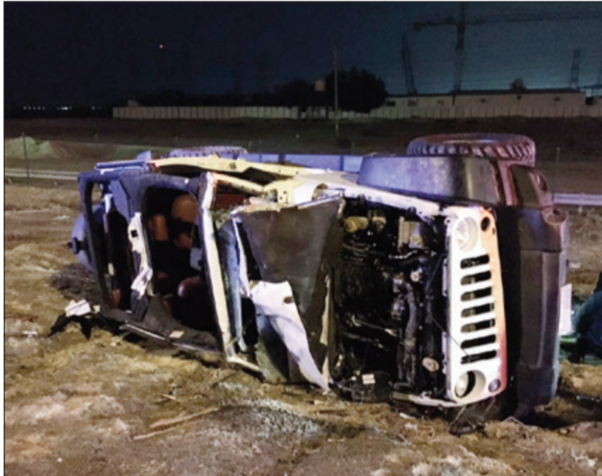
الرباعية التي انقلبت بمطريق الملك فهد