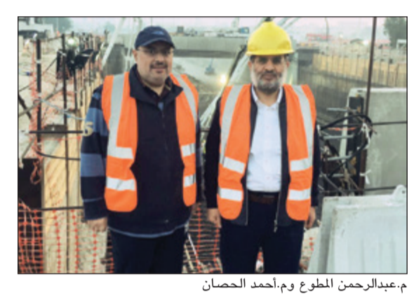
م.عبدالرحمن المطوع وم.أحمد الحصان

قام وزير الأشغال العامة م.عبدالرحمن المطوع صباح أمس بزيارة موقعية لمتابعة أعمال صب خرسانة النفق الخاص بالدائري الثاني على طريق الجهراء ضمن مشروع تطوير طريق الجهراء بحضور الوكيل المساعد لقطاع هندسة الطرق في وزارة الأشغال العامة م. أحمد الحصان ومهندسي المشروع من الجهاز التنفيذي والاستشاري والمقاول وعدد من مديري ومهندسي القطاع. في تصريح صحفي على هامش الزيارة أن إنجاز اليوم يعد مرحلة مهمة من المراحل التنفيذية في مشروع تطوير طريق الجهراء أحد الطرق الاستراتيجية ضمن شبكة الطرق والذي بلغت نسبة إنجازها الإجمالية 93%