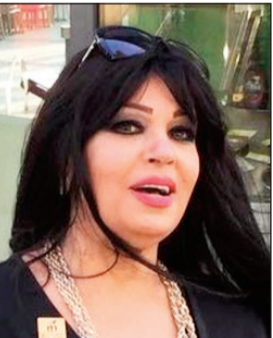
في في عبده

كشفت الفنانة فيفي عبده عن مفاجأة لجمهورها في ليلة رأس السنة عبر حسابها الشخصي على «انستغرام»، ونشرت عبده فيديو لها قالت فيه لجمهورها: «حبيت أقولكم على المفاجأة اللي محضرا لها كم في رأس السنة، هقعده معاكم ساعة ونصف من البيت عندي في الصالون بتاعي وهقدملكم رقصات وأغاني جديدة مباشر على صفحتي على اليوتيوب، وإن شاء الله تعجبكم، وتقدرنا تشوفوني من جميع أنحاء العالم».