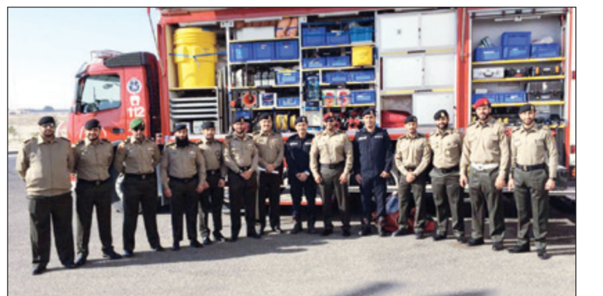
لقطة جماعية لضباط في مركز اطفاء مبارك الكبير

المواد الخطرة وكيفية التعامل معها، وشرح على بعض المعدات والأليات الخاصة سبل التعامل مع المواد الخطرة، مما يزيد من معرفة وتنمية قدرات الشخص في التصرف الأولى في حالة حدوث أي تسرب للمواد الخطرة. تاتي الزيارة في إطار التعاون وتبادل الخبرات بين الجهات العسكرية.