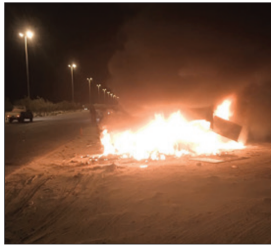
النار التيهمت المركبة الرياضية

ومقطورة) على طريق الملك فهد بالقرب من محطة بنزين النويصيب باتجاه مدينة توفيقان، وقام رجال الفور رجال إطفاء مركز النويصيب بقيادة النقيب يوسف مراد للتعامل مع الحادث، وعند وصول رجال الإطفاء للموقع تبين أن المركبة الرياضية