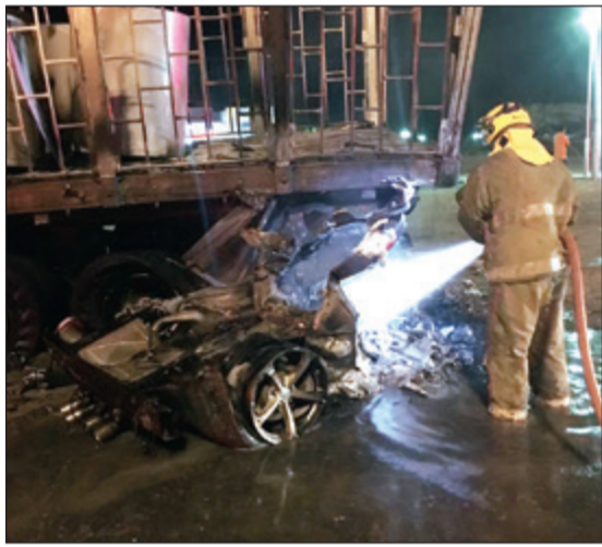
رجل اطفاء يخمّد حريق المركبة