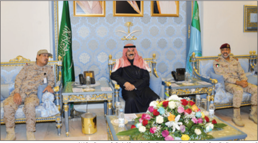
الشيخ محمد الخالد والفريق الركن الشيخ عبدالله النواف واللواء الركن عبدالله الغفاري