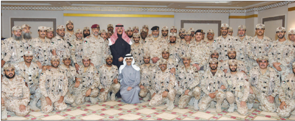
الشيخ محمد الخالد متوسطا أفراد القوة البرية