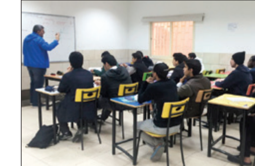
السفير ياسر عاطف يفتتح المعرض بحضور د.نبيل بهجت

افتتح السفير المصري ياسر عاطف يرافقه المحقق الثقافي د.نبيل بهجت معرض الفنان هشام عطية بمقر المكتب الثقافي وبحضور عدد كبير من الفنانين والمهتمين بالفن التشكيلي. وقال د. نبيل بهجت في تصريح: إن معرض الفنان هشام عطية يأتي في إطار الاهتمام بالفن والفنانين وحرص السفارة المصرية على إبراز إبداعات الفنانين المصريين المقيمين بالكويت الشقيقة من خلال عرض أعمالهم الفنية بصفة دائمة بما يعكس الامتداد