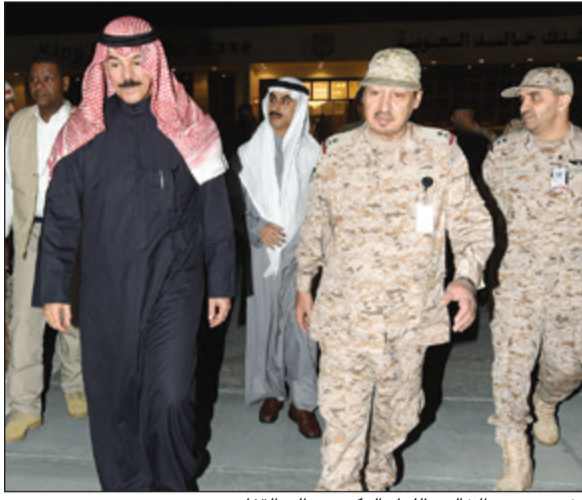
الشيخ محمد الخالد واللواء الركن عبدالله الغفاري