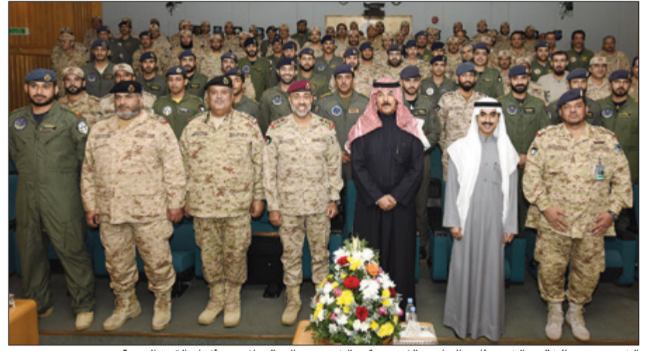
الشيخ محمد الخالد والشيخ ثامر الجابر والفريق ركن الشيخ عبدالله النواف مع أفراد القوة الجوية