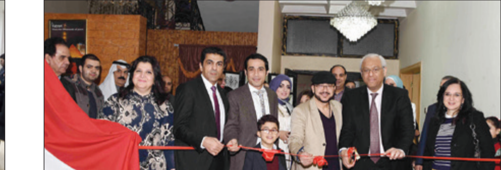
السفير ياسر عاطف يفتتح المعرض بحضور د.نبيل بهجت

الضاري للفن التشكيلي المصري ومدى تفاعله مع معطيات العصور المختلفة. وأوضح أن المعرض يمثل أسلوباً ذاتياً مبتكراً نمطاً يعتمد على استحداث تداخلات لونية بكثافة أحياناً وشغافية أحياناً أخرى عن طريق بعض التقسيمات والحركات المدروسة. وأشار إلى ان المعرض يضم خمسة عشر لوحة تنوعت موضوعاتها، فمنها ما يتناول أشكال البيوت الريفية القديمة بما تحمله من عبق تشكيلي وأخرى تتناول الحياة اليومية.