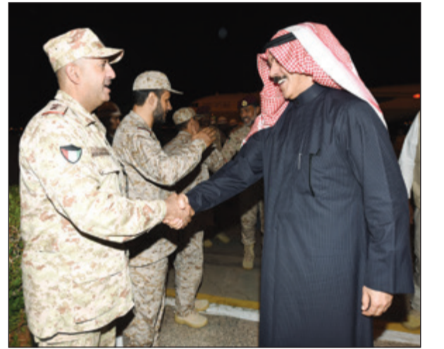
الشيخ محمد الخالد مصافحا أحد ضباط القوة البرية

المنطقة، كما تم استعراض العلاقات الثنائية بين البلدين الشقيقين لاسيما المتعلقة في الجوانب العسكرية بالإضافة إلى تبادل وجهات النظر والتنسيق حول دعم أطر التعاون الأمني في مواجهة الأحداث التي تمر بها المنطقة. وكان في وداع الخالد لدى مغادرته المملكة سفيرنا لدى المملكة العربية السعودية الشيخ ثامر الجابر ومساعد وزير الدفاع السعودي محمد العايش وعدد من كبار القيادات العسكرية.