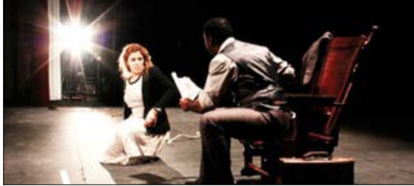
حنان المهدي في أحد أعمالها المسرحية