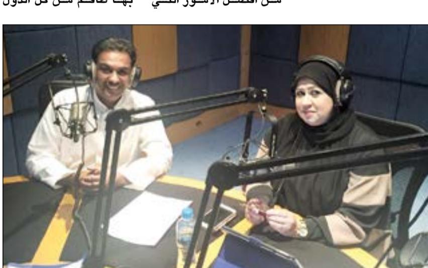
طلال الماجد مع أمل محمد في برنامج «مراحب»

كيف تنظر للمنظومة الاعلامية في الكويت والعالم العربي؟ ● أرى ان ربط الإذاعات العربية في بث مشترك من أفضل الامور التي