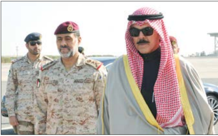
الشيخ محمد الخالد لدى مغادرته البلاد

امس في زيارة رسمية للمملكة العربية السعودية. وكان في استقباله لدى وصوله المطار ولي العهد النائب الثاني لرئيس مجلس الوزراء وزير الدفاع السعودي صاحب السمو الملكي الأمير محمد بن سلمان آل سعود وسفيرنا لدى المملكة العربية السعودية الشيخ فامر الجابر وعدد من المسؤولين. وكان الشيخ محمد الخالد يرافقه نائب رئيس الأركان العامة للجيش الفريق الركن عبدالله نواف الصباح وعدد من أعضاء مجلس الدفاع العسكري قد غادر متوجها إلى المملكة العربية السعودية الشقيقة وذلك لزيارة القوة الكويتية المشاركة في «إعادة الأمل».