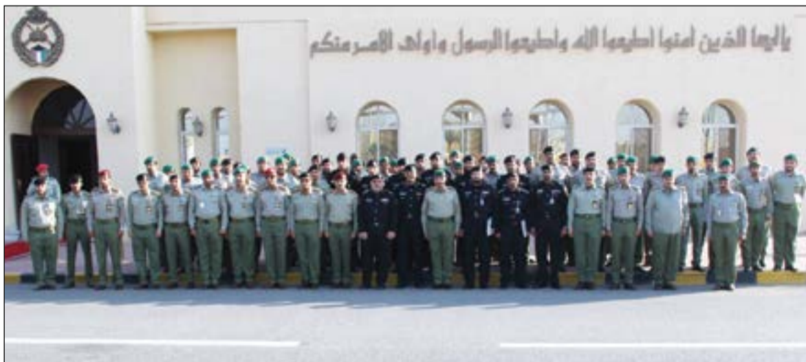
خريجوا الدورتين في صورة جماعية

الإشارة وأهمية التعرف على الأجهزة الحديثة المستخدمة وكيفية استخدامها بكل كفاءة. وأوضح اللواء الركن فالح شجاع أن القيادة العليا للحرس الوطني تضع نصب أعينها الوصول بمنتهى الجاهزية لإدابة وأجباتهم بمهنية واحتراف وتوفير لذلك أحدث الأجهزة والوسائل التدريبية المتطورة لتطور التعليم العسكري على مستوى العالم.