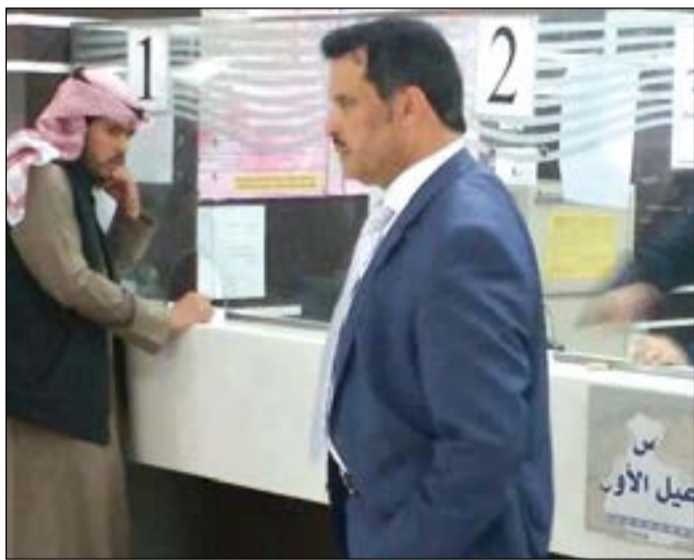
جانب من الجولة