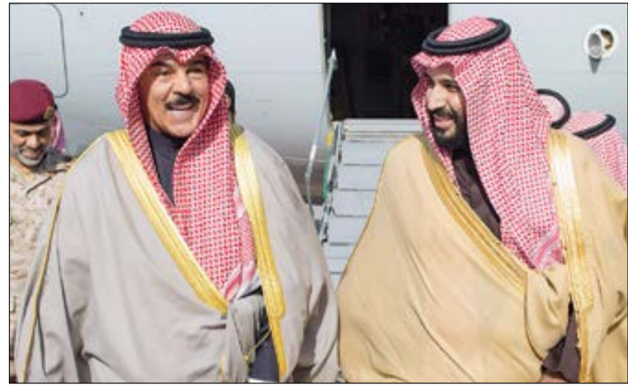
صاحب السمو الملكي الأمير محمد بن سلمان في استقبال الشيخ محمد الخالد لدى وصوله إلى الرياض

متوجها إلى جنوبي المملكة العربية السعودية لتفقد القوات الكويتية المشاركة في التحالف العربي لإعادة الشرعية في اليمن.