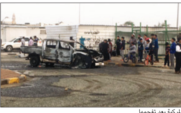
المركبة بعد تفحمها