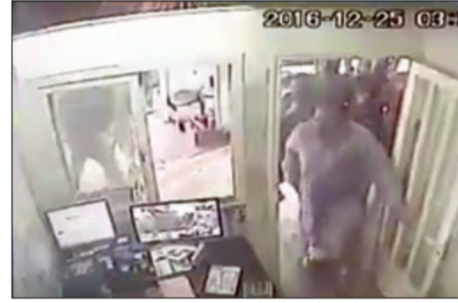
الجننة لدى دخولهم مكتب المحاسب

خدمة تبديل الزيوت والكهرباء وغيرها من الامور المتعلقة بأعمال الميكانيكا. وجاء ضبط المتهمين في الواقعة بعد ان تداول نشطاء على مواقع التواصل الاجتماعي واقعة دخول المواطنين الأربعة الى غرفة المحاسب وضربه بشكل عنيف مستخدمين العجرات وغيرها من الوسائل التي سقط على اثرها المحاسب أرضاً بفعل نواله وعنف الضربات، وكانت كاميرا مثبتة داخل غرفة المحاسب وثقت