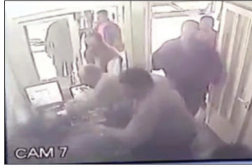
كاميرا المراقبة وثقت عملية الاعتداء

عملية الاعتداء بشكل واضح. وبحسب مصدر أمني، فإن تداول المقطع دفع وزارة الداخلية الى وضع القضية في بؤرة الاهتمام ليتم توقيف الاب وأحد ابناءه، ومن خلال التحقيقات زعم الاب ان المحاسب رفض ان يقوم بتعبئة اطر سيارته بالهواء إنحما اعتبر المحاسب هذه المزاعم غير صحيحة باعتباره لا علاقة له بأعمال المحل، وأن دوره يقتصر على محاسبة العملاء ومتنهم الفواتير.