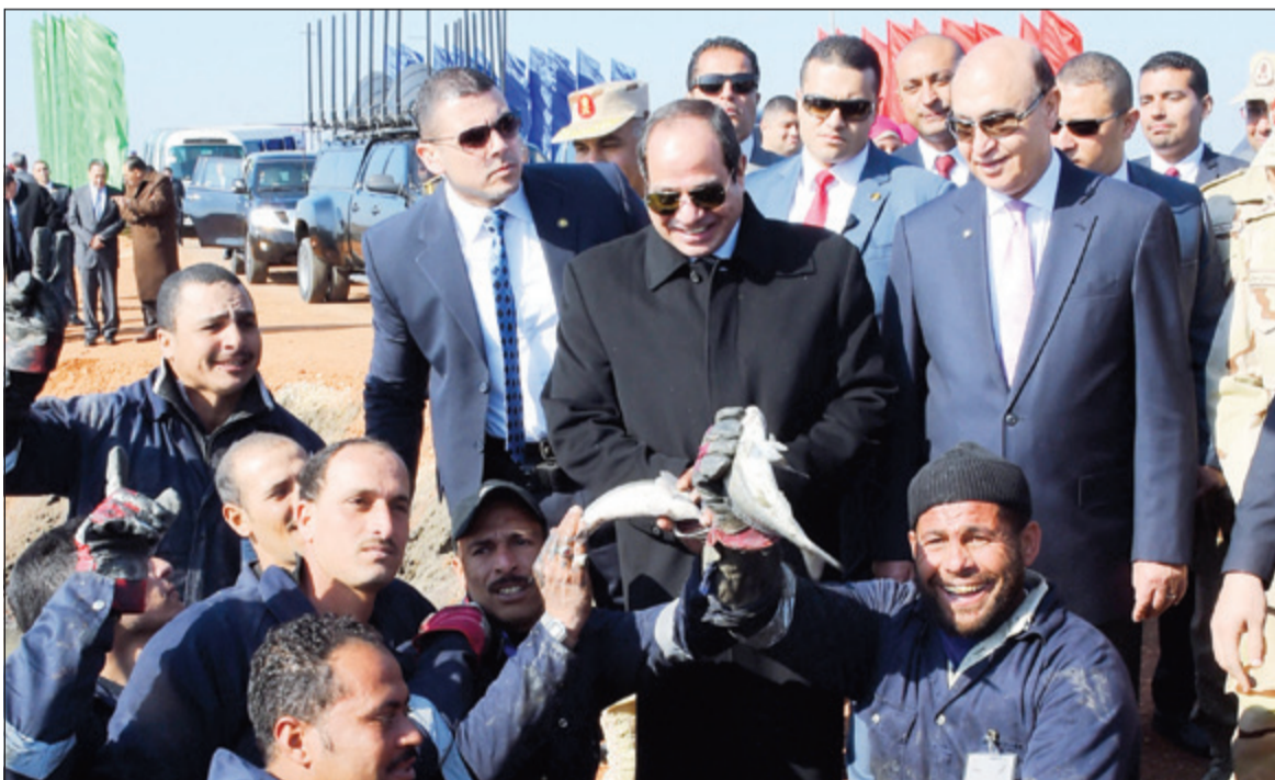
الرئيس عبدالفتاح السيسي في لحظة تذكارية مع العاملين في مشروع الاستزراع السمكي في مدينة الإسماعيلية

دعا الرئيس عبدالفتاح السيسي جميع المسؤولين في الدولة لمكافحة الفساد في الدولة، جنبا إلى جنب مع الجهود الكبيرة التي تبذلها هيئة الرقابة الإدارية، مطالبا المحافظين بمخاطبة أساتذة الجامعات الموجودة في نطاق محافظاتهم، للاطلاع على المشاريع المختلفة، مضيفا: «لو أنا مسؤول وحطيت يدي على كل صغيرة وكبيرة في المشروع فإن فرصة التجاوز تصبح قليلة».