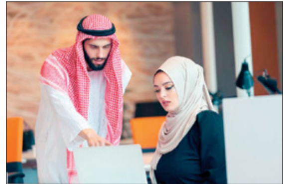
تحديات كبرى تواجه مساهمة المرأة العربية في سوق العمل

تخيل لو أنك مدير شركة ذات طموحات كبيرة وعلمت أن بإمكانك زيادة عائدات شركتك بنسبة تصل الى الثلث، وذلك ببساطة عن طريق الاستخدام الأفضل للموارد البشرية والمواهب المحلية الموجودة لديك، لا بد أنك ستعمل على الفور على التعرف على هذه الفرصة العظيمة الماثلة أمامك وربما تسعى لاستفادة منها بأسرع وقت ممكن، وهذا بالضبط ما توفره القوى العاملة من الإناث في الشرق الأوسط للحكومات في العالم العربي.