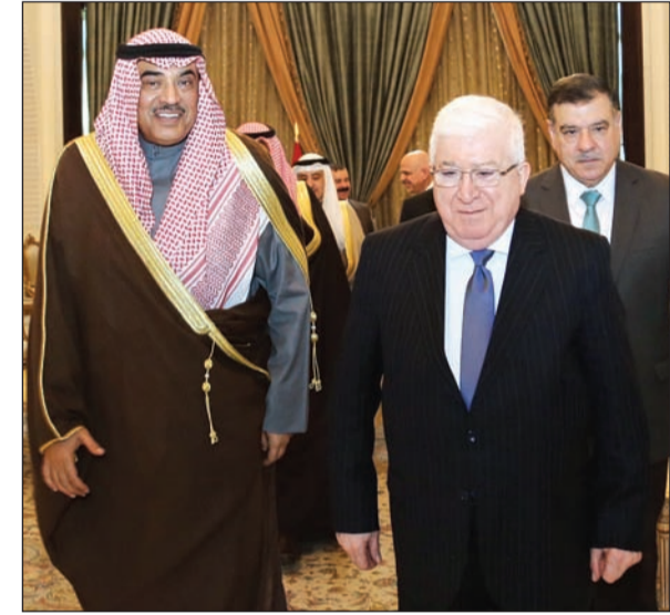
الشيخ صباح الخالد خلال لقائه الرئيس العراقي د.فؤاد معصوم في بغداد أمس

■ تأجيل دفعة التعويضات العراقية المستحقة إلى 2018 ■ 200 مليون دولار دعماً كويتياً لاحتياجات النازحين العراقيين ■ آليات وخبرات كويتية لإطفاء الآبار النفطية في حقل القيارة