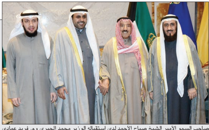
صاحب السمو الأمير الشيخ صباح الأحمد لدى استقباله الوزير محمد الجبري وم. فريد عمادي والقارئ خالد العيناوي

الأمير مشيداً بفوز العيناوي بـ «أول الأوائل» في القرآن الكريم: «هذا بلدكم وكثر ما تقدرون تسعون في رفعتهم وعلو مكانته اسعوا»