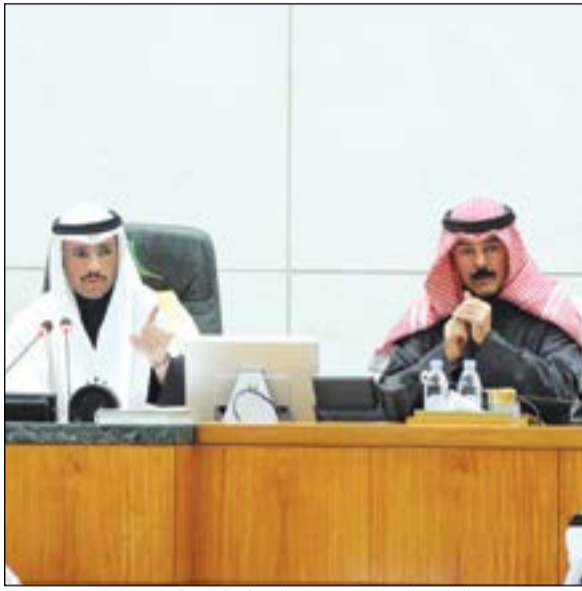
الرئيس مرزوق الغانم والشيخ محمد الخالد على المنصة