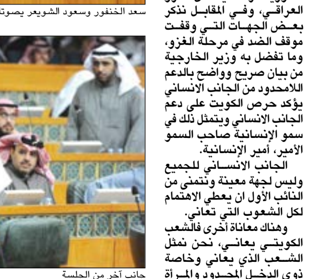
جانب آخر من الجلسة

الجانب الانساني للجمع وليس لجهة معينة ونتمنى من النائب الأول ان يعطي الاهتمام لكل الشعوب التي تعاني. وهناك معاناة اخرى فالشعب الكويتي يعاني، نحن نمثل الشعب الذي يعاني وخاصة ذوي الدخل المحدود والمرأة