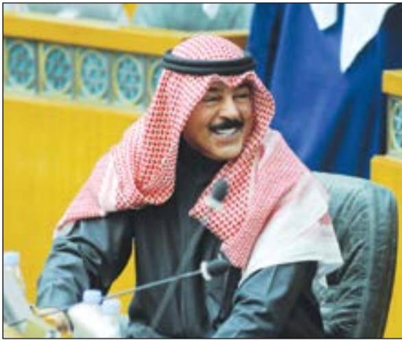
الشيخ محمد الخالد أثناء الجلسة