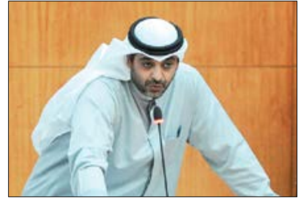
الشيخ محمد العبدالله