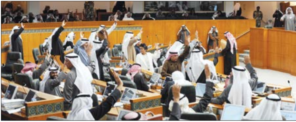
المجلس يصوت على تشكيل اللجان