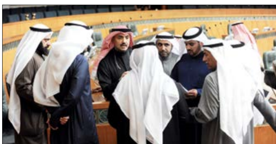
محمد الطير وحوله النواب في نقاش حول أحد الاقتراحات