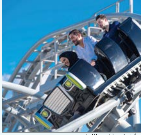
..والعاب السرعة لمحبي المغامرات