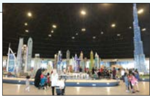
مدينة علاقة من المكعبات وبرج خليفة أعلى مجسم من الليجو في العالم