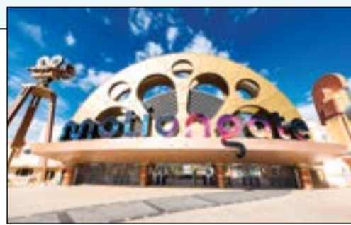
موشن جيت وجهة سياحية مع أبطال هوليوود والشخصيات الكرتونية

منتزه «بوليوود بارك دبي» هو المنتزه الترفيهي الأول من نوعه، والذي يعرض تجارب أفلام «بوليوود» الأصيلة. ويعيد هذا المنتزه تقديم تجربة بوليوود بكل تفاصيلها المذهلة من خلال معالم الجذب الترفيهية والألعاب التي تنتشر عبر خمس مناطق سينمائية متخصصة وهي: «بوليوود بوليفارد»، «مومباي تشوك»، «راستيك رافين»، «روبال بلازا»، و«استديوهات بوليوود السينمائية»، والتي تضم قاعة الأبطال. وفي قلب «بوليوود بارك دبي» تكمن جوهرة التاج لهذا المنتزه، مسرح «راج محل» الفأخر، بمقاعد لـ 850 المجهزة لاستضافة عروض «بوليوود» الموسيقية ببطاقات تذاكر منفصلة بأسلوب «برودواي»، وتقدم لأول مرة في المنطقة عبر عدة حفلات أسبوعية. وخلال اليوم، يستقبل المنتزه حوالي 20 عرضاً مباشراً تقدم على 7 منصات، كما يشتمل المنتزه على 6 مطاعم مميزة تقدم وجباتها الحافلة بنكهة المطبخ الهندي الشهبي، مع 8 متاجر تعرض منتجات مستوحاة من أجواء الأفلام الشهيرة.