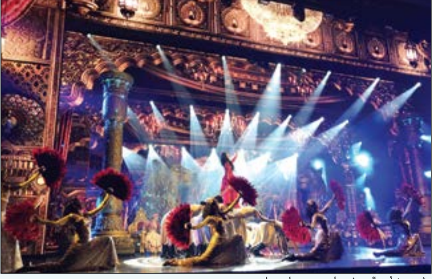
مشهد من أحد العروض على مسرح راج محل