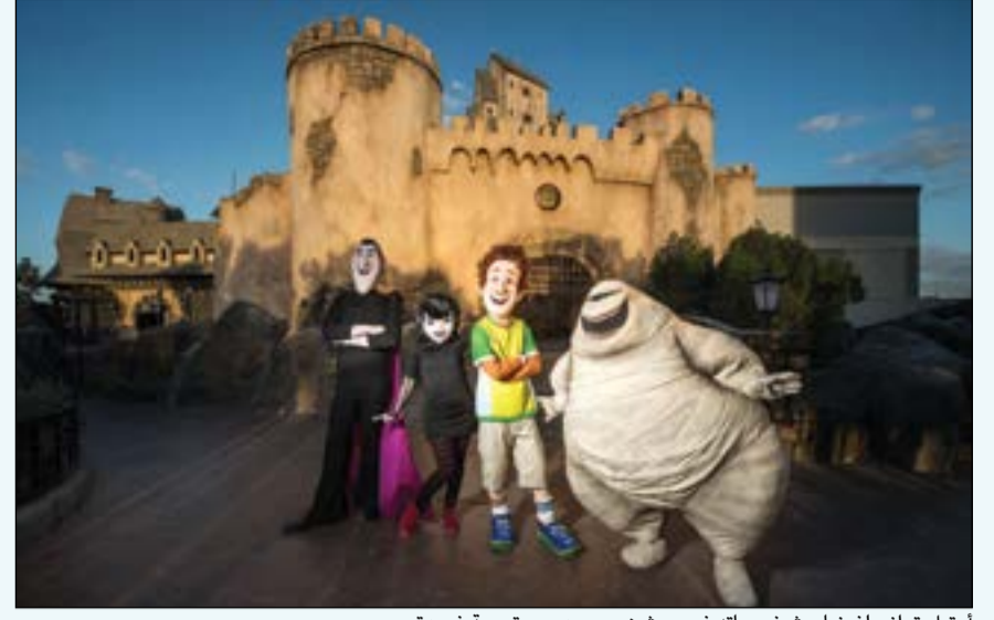
أوتيل ترانسلفينيا وشخصياته في موشن جيت دبي.. تجربة فريدة