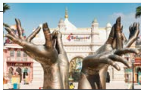
بوليوود بارك لمحبي أبطال السينما الهندية وأفلامها

منتزه «ليجولاند دبي» الوجهة المثالية على مدار العام لمغامرات عالم العباب «ليجو» للعائلات والأطفال بين 2 و12 سنة. وستتميز «ليجولاند دبي» بما يزيد على 40 لعبة تفاعلية، وعروض ومعالج ترفيهية، وما يزيد على 15,000 مجسم لماناج «ليجو» تشمل ما يزيد على 60 مليون قطعة من مكعبات «ليجو». ويقدم «ليجولاند دبي» ست من المناطق الترفيهية تنفرد كل منها بالعروض الترفيهية والتعليمية والخبرة التي تقدمها، وتشمل: «ليجو سيتي»، «المالك»، «أرض الخيال»، «أرض المغامرة»، «المدنية المصغرة التي تتيح للعائلات الاستمتاع برؤية مجموعة كبيرة من المجسمات المعروفة والتي تحاكي منطقة الشرق الأوسط والمناطق الأهم عالمياً مثل مجسم برج خليفة، أطول مجسم مصنوع من مكعبات ليجو في العالم والذي يصل طوله لـ 15 متراً، ويعتبر «ليجولاند دبي» المنتزه الأول في الشرق الأوسط، والسابع بين منتزهات «ليجولاند» الموزعة في العالم.