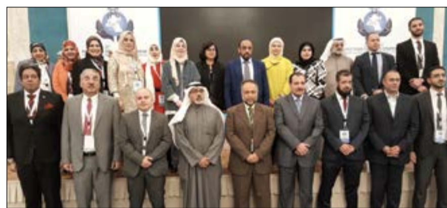
جانب من المشاركين في المؤتمر