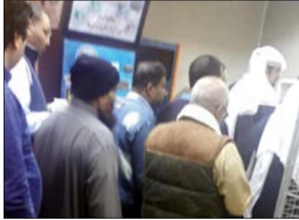
.. وطوابير طويلة مقابل «الجديدة»

والمستوصفات ازدحاما شديدا نظرا لعدم وجود مكائن كافية للطوابع الإلكترونية والتي تكلف المقرر أن يتم تعميمها بشكل كامل بدلا عن الطوابير الوردية.