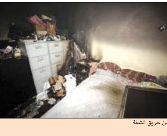
من حريق الشقة

من جهة أخرى، قدم مواطن إلى مخفر شرطة الزهراء تقريراً طبيًا صادرا عن مستشفى مبارك يتضمن تورما وانتفاخا بالأنف ونزيفا في فتحة الأنف اليسرى وكسرا بعظام الانف، وقال ان شخصا يقود مركبة صالون يابانية اعتدى عليه اثر خلاف على اولوية السير خلال سيره على طريق الملك فهد باتجاه الاحمدي مقابل منطقة الشهداء.