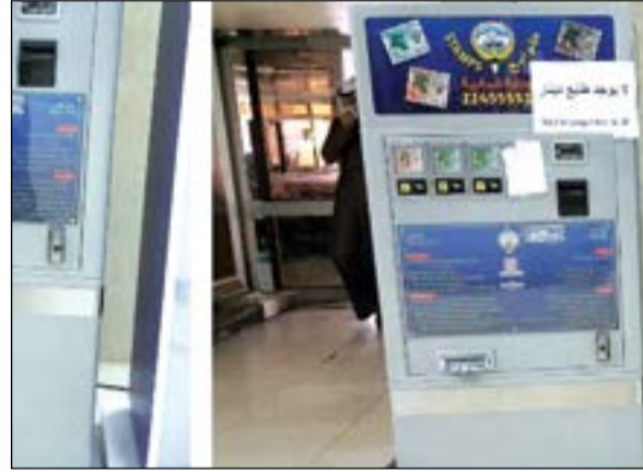
المكائن القديمة خارج الخدمة