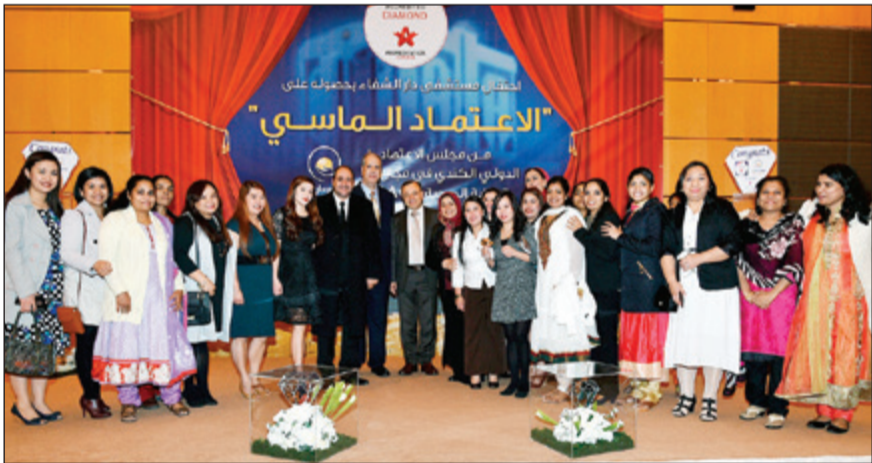
نصرالله متوسطاً فريق العمل خلال الحفل

المستشفى معياراً لاعتماد الجودة في المنطقة. تحلل الحفل عرض مقاطع فيديو لمشاهدة النتائج بين عدد من العاملين بمختلف الأقسام الطبية والإدارية، سحوبات على قسائم شرائية والهدايا العينية.