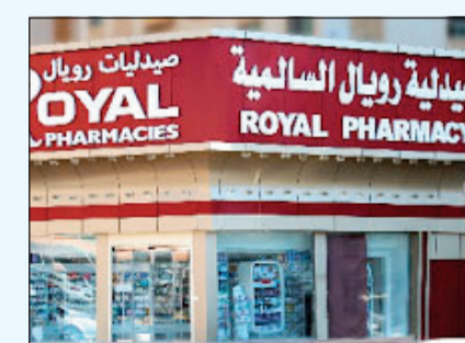
صيدلية رويال السالمة

المنشرة بكل مناطق الكويت وأسفر هذا التعديل عن زيادة رقعة الراغبين في الحصول على العرض بشكل أكبر والتسهيل عليهم لتسجيل بياناتهم ما أدى لسهولة التلبية وزيادة العدد المطلوب من الكراسي لتغطية الطلب الكثيف من جمهور المتعاملين مع صيدليات رويال. ونظراً لنفاد الكمية، قامت المجموعة بطلب أعداد أخرى بشكل سريع ومع ذلك نفذت، ما اضطر المجموعة لتقديم شكر