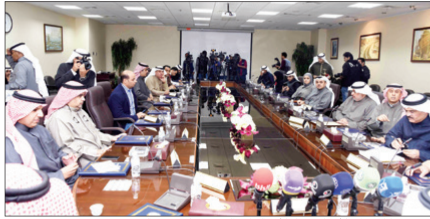
عدد من قيادات وزارة الأشغال وجهات الأمن الوطني الحضور خلال توقيع العقد

على 3 سرايب ويحتوي المبنى على مخبأ (shelter)، بالإضافة إلى حدائق وطرق وعناصر مائية، علماً بأن العقد يشتمل على تصميم وتنفيذ المباني بنظام Design-Build وذلك سعياً لتقصير مدته قدر الإمكان ومواصفات سيارات موزعة بمنطقة الديبلوماسية بمساحة تقدر بـ 8 آلاف متر مربع، موضحاً أن المشروع عبارة عن مبنى رئيسي بـ 6 أدوار ويحتوي على مكاتب إدارية وخدماتها ومواصفات سيارات موزعة بمنطقة الديبلوماسية (المنطقة الديبلوماسية) بمساحة تقدر بـ 8 آلاف متر مربع، موضحاً أن المشروع يقع في منطقة مبارك العبدالله (المنطقة الديبلوماسية) وتبلغ مساحة الموقع 8000 متر مربع وتنقسم إلى 5000 متر لمساحة المبنى الرئيسي و3000 متر لمواقف السيارات ويتكون المشروع من ستة ادوار ويحتوي على مكاتب إدارية وخدماتها ومواصفات سيارات موزعة على ثلاثة سرايب ويحتوي على مخبأ (shelter)، بالإضافة إلى حدائق وعناصر مائية، وأقوات الغنيم بأن التكلفة الإجمالية للمشروع 12,740 مليون دينار بمدة تنفيذ 1095 يوماً من خلال قطاع المشاريع الإنشائية بالوزارة.