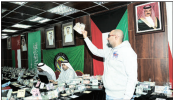
جانب من المزاود

هو فكري التي تنطلق من مبدأ تجميع الهواة في موقع واحد، حيث يستلم على 83 محلاً تتنوع ما بين أمتك ومسابيح وعملات وما شابه ذلك، بالإضافة إلى عمل صالة مزاود خاصة تم تخصيصها، تسهم في تنمية الهوايات وتجميع أصحابها واجتذاب الراغبين في ذلك وإرشادهم وتعريفهم بالتاريخ والعملات، إلى جانب وجود مزاود أيضاً للأحجار والمقتنيات والورقيات والانتيك والمسابيح. وأشار إلى أنه قام بالعديد من الإجراءات التي تسهل عملية التواصل مع هواة العملات