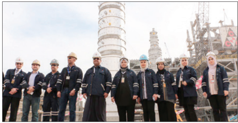
صورة جماعية لوفد التخطيط، مع المسؤولين في البترول أمام المشروع