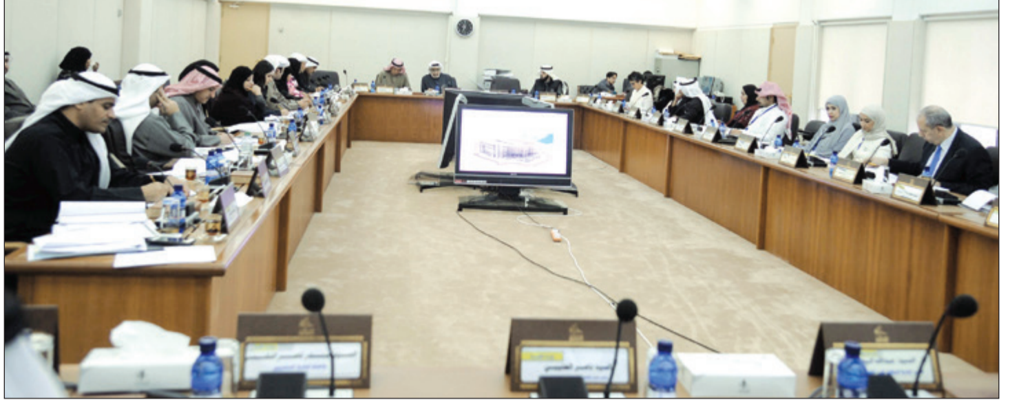
جانب من اجتماع لجنة الميزانيات

جواز إقرار الميزانية بأبأ، حيث اقترح الديوان إقرار الباب الخاص بالمشاريع الرأسمالية في بداية السنة المالية لتعديل أخذ الموافقات الخاصة بالمشاريع التي تتطلب وجود اعتماد مالي في الميزانية، الأمر الذي لا تعارضه اللجنة من حيث المبدأ. كما طرحت اللجنة موضوع عقد جلسة عامة لمتابعة أهم الملاحظات والمخالفات التي سجلها ديوان المحاسبة على الجهات الخاضعة لرقابته على غرار ما حدث في الفصل التشريعي السابق، خاصة أنه قد نتج من هذه الجلسات ارتفاع نسبي في تسوية الملاحظات المسجلة على الجهات الحكومية.