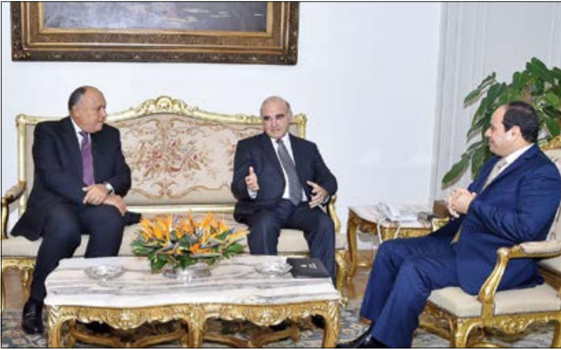
الرئيس عبدالفتاح السيسي مستقبلاً وزير خارجية مالطا دوجور فيلا بحضور سامح شكري

وزيرة تظهر احياناً وتختفي احياناً كثيرة إما بسبب أموال التامينات أو هجوم أصحاب العاشات أو المستحقين عنهم لعدم قدرتها على زيادتها وتكتفي بالحديث الممل عن أموال ومعاشات التكافل وتسعى إلى الظهور على المسرح السياسي من جديد لكن الظروف لا تساعدها.