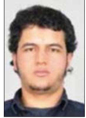
صورة أصدرتها الشرطة الألمانية لاثنين العنصراري التونسي المشتبه في تورطه في هجوم برلين