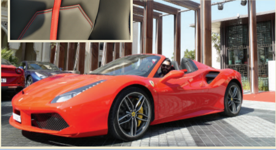
الزميل طلال بارا خلال تجربة القيادة