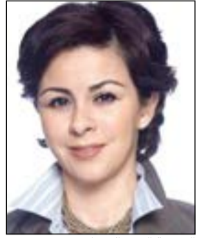
الشيخة الزينة الصباح

وناقشت الصباح جهود وزارة الدولة لشؤون الشباب في مناهضة التمييز ضد المرأة،