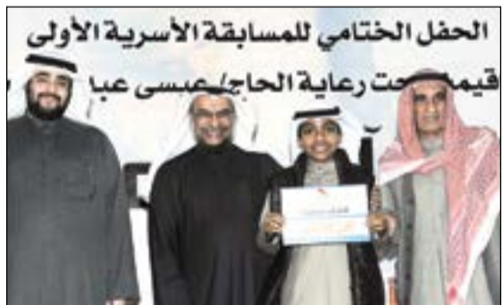
تكريم أحد حفظة القرآن الكريم