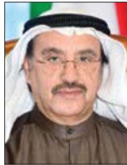
الفريق أول أحمد الرجيب