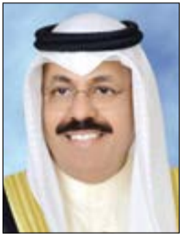
الفريق أول م. الشيخ أحمد النواف