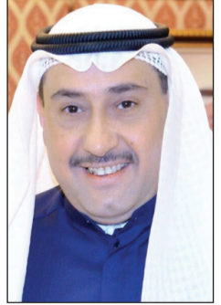
الشيخ فيصل الحمود

أشاد محافظ الفروانية الشيخ فيصل الحمود بالخطوات النيابية الداعية إلى معالجة التركيبة السكانية في البلاد، واستبعاد مليون وافد من العمالة الهامشية والسائبة وضحايا تجار الاقامات وأصحاب المشاكل، خصوصاً أن أمن الكويت واستقرارها ومصحتها فوق أي اعتبار.