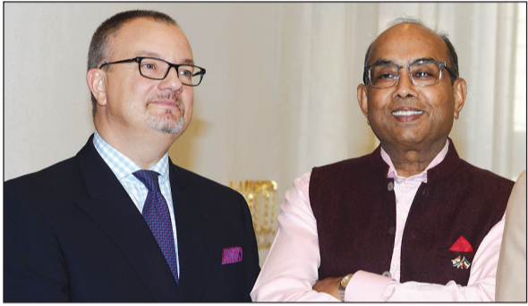
السفير البريطاني ماثيو لودج والسفير الهندي سونيل جين

لجهودهم. وردا على سؤال حول نتائج زيارة وزير الدولة البريطاني لشؤون الشرق الأوسط وأفريقيا توبياس إلسود للكويت الأسبوع الماضي، وصف لودج الزيارة بالنجاح، مشيرًا إلى أنه تم خلالها توقيع اتفاقية تسليم المجرمين بين البلدين، ما سيساهم في تعزيز التعاون الأمني بينهما، كما كشف عن أنه لم يتم تحديد موعد انعقاد لجنة التوجيه المشتركة بين البلدين إلى الآن ولكنها ستعقد في القريب العاجل. بدوره، اعتبر عميد السلك الدبلوماسي سفير السنغال عبدالاحد امباكي اغتيال السفير الروسي لدى أنقرة عملاً إرهابياً ولا علاقة له بالإسلام، مندداً بما وصفه بالجريمة الشنيعة، متقدماً بخالص تعازيه لسفير روسيا لدى الكويت وللشعب الروسي.