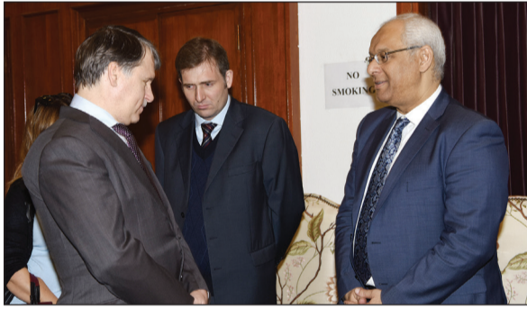
السفير المصري ياسر عاطف معزيا