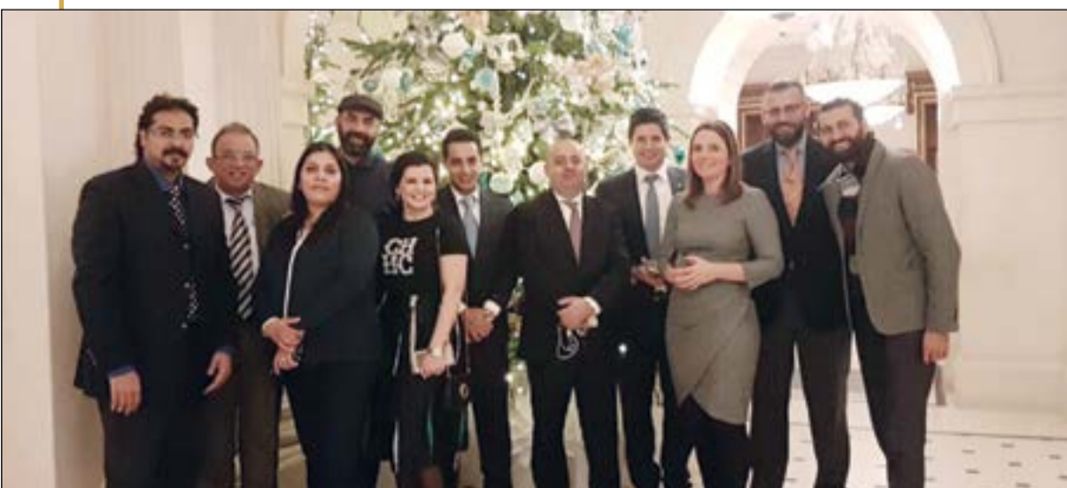
صورة تذكارية للوفد في فندق «لينزبره»

ولكن التراث يقف عند هذا الجانب وكل ما عدا الديكور والتحف ينتمي إلى فترة افتتاحه وحتى الوقت الحاضر مع لمسات مستقبلية واضحة تتمثل في استخدام أحدث ما توصلت إليه التكنولوجيا في مجال الخدمات والاتصالات. وكما تقول إدارة الفندق لا ينقص صورته التراثية إلا العربات التي تجرها الخيول ولكن هذه أصبحت للاسف من الماضي وحلت محلها سيارات الليموزين الفارهة.